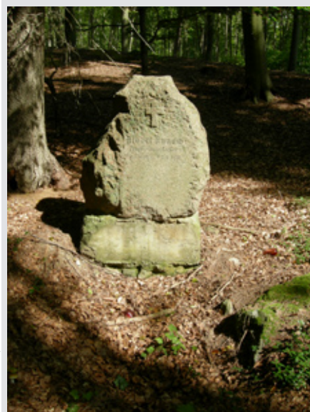
Ryc. 5 Pomnik A. Kunowa