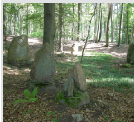
Ryc. 2 Widok cmentarza

Duży wpływ na obecny stan ekosystemów leśnych Nadleśnictwa Chojna, miał i, co istotne, ma na-