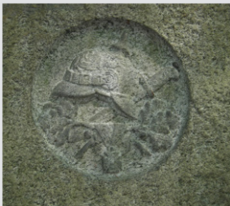
Ryc. 4 Zbliżenie fragmentu ryc. 3 Forsteinrichtung und Waldbau, Bd 3 H. 11/12, 1944.

K. Hubner, Neue Wege und Ziele des Waldbaues in Deutschland , „Zeitschrift für Weltforstwirtschaft“, Sonderheft: Deutschland, Gruppe IV: