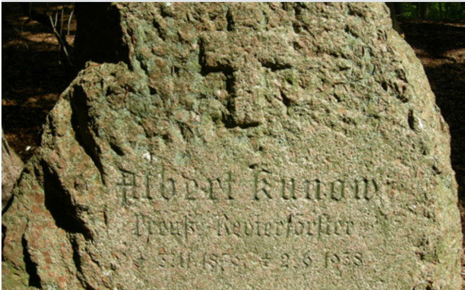
Ryc. 6 Fragment ryc. 5