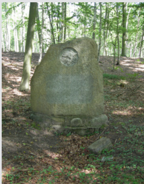
Ryc. 3 Pomnik poległych w wojnie francusko-pruskiej

dal sposób prowadzenia gospodarki leśnej przez niemieckich leśników. Po 1945 r. nastąpiła dalsza kontynuacja zagospodarowania lasu, która uwzględniając zmiany wynikające z rozwoju nauki, jaką jest leśnictwo, trwa po dzień dzisiejszy. Współczesnym chojeńskim leśnikom przypadało w udziale nadanie nowego wymiaru jakościowego gospodarce leśnej naszych terenów. Obecne leśnictwo wielofunkcyjne ma za zadanie zaspokajanie różnorodnych potrzeb społecznych przy zachowaniu trwałości i wzrostu zasobów leśnych 6 . Jest to dalekowzroczone podejście gwarantujące możliwość czerpania pożytków z lasu przy zachowaniu wszelkich jego walorów przyrodniczych, kulturowych i historycznych. Można stwierdzić, że dzisiejszy las, ze względu na swoją długowieczność, to najlepszy żywy dowód efektów pracy wielu pokoleń leśników zarówno niemieckich, jak i polskich.