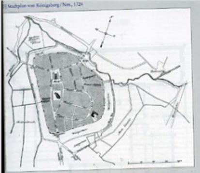
Ryc. 1 Lokalizacja klasztoru na planie miasta z 1724 r.