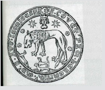
Ryc. 3 Pieczęć augustianów chojeńskich z 1484.