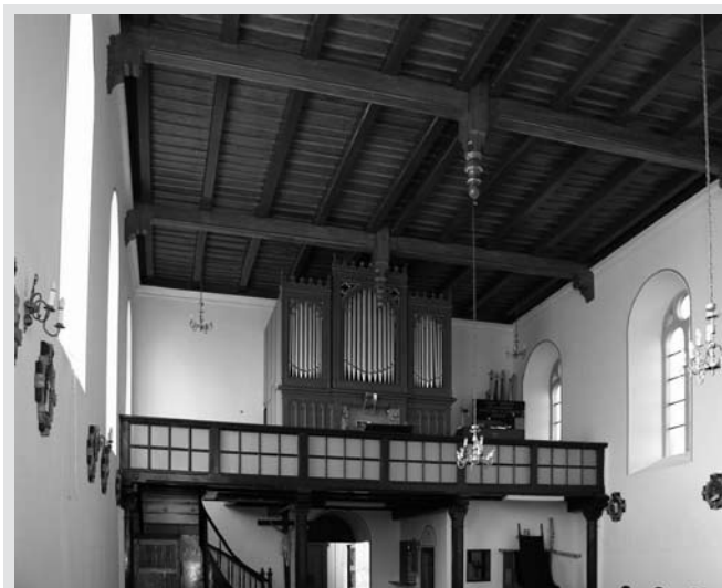
Bild 7: Die erhaltene Orgel von Friedrich Bütow (1876) in Góralice (vor 1945 Görlsdorf Kreis Königsberg/Neumark)