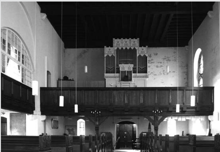
Bild 9: Die 2011 restaurierte Orgel von Paul Bütow (1902) in Neuenhagen (Ortsteil von Bad Freienwalde, vor 1945 Kreis Königsberg/Neumark)