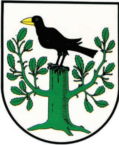
13. Herb miejski Gozdnicy