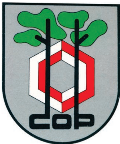
5. Herb miejski Nowej Sarzyny