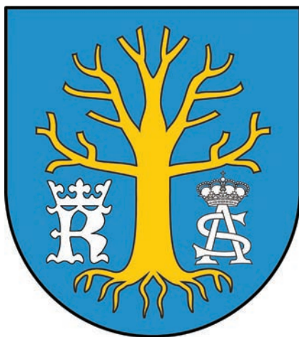
20. II. projekt herbu gminy Osiek Jasielski