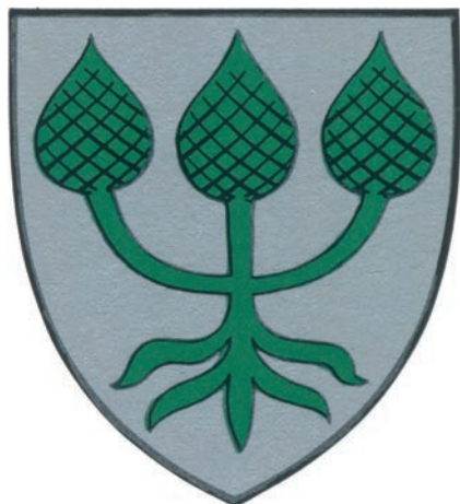
3. Herb rodziny Godziemba