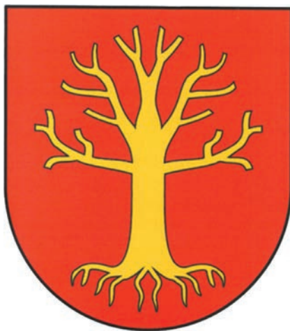
22. IV. projekt herbu gminy Osiek Jasielski