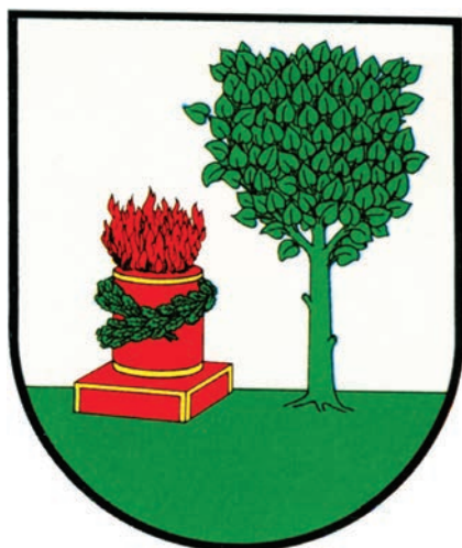
11. Herb miejski Białej Piskiej