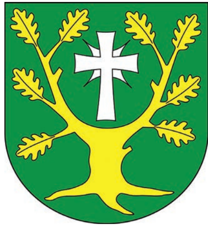
14. Herb gminy Chodów