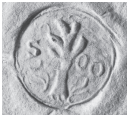
1. Pieczęć Osieka Jasielskiego z 1554 roku