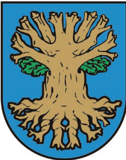
15. Herb gminy Suchy Dąb