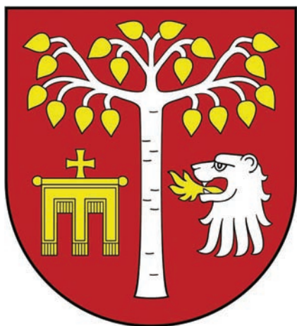
17. Herb gminy Brzeźnica