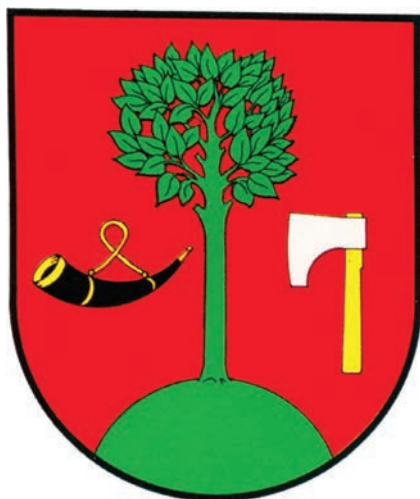
9. Herb miejski Limanowej