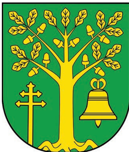
18. Herb gminy Malanów