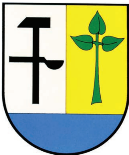
7. Herb miejski Bukowna