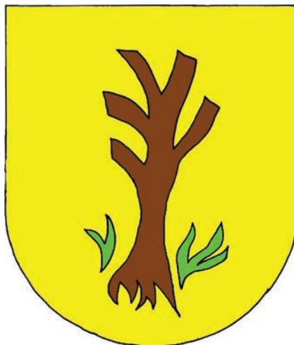
2. Hipotetyczny, średniowieczny herb Osieka Jasielskiego