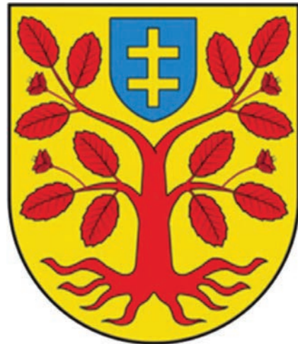
16. Herb gminy Zbuczyn