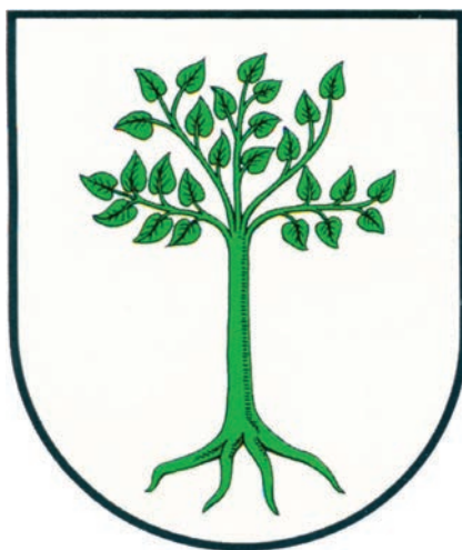
6. Herb miejski Kruszwicy