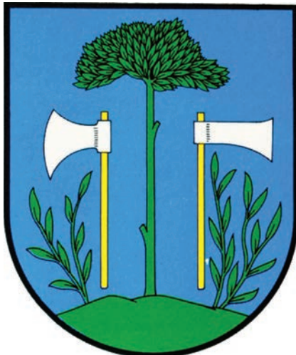
12. Herb miejski Mysłenic