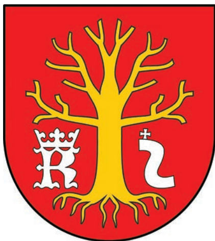
21. III. projekt herbu gminy Osiek Jasielski