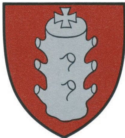
4. Herb rodziny Nieczuja