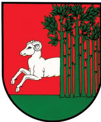
8. Herb miejski Bojanowa