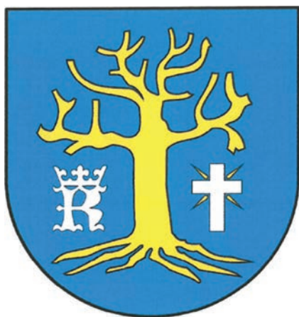
19. I. projekt herbu gminy Osiek Jasielski