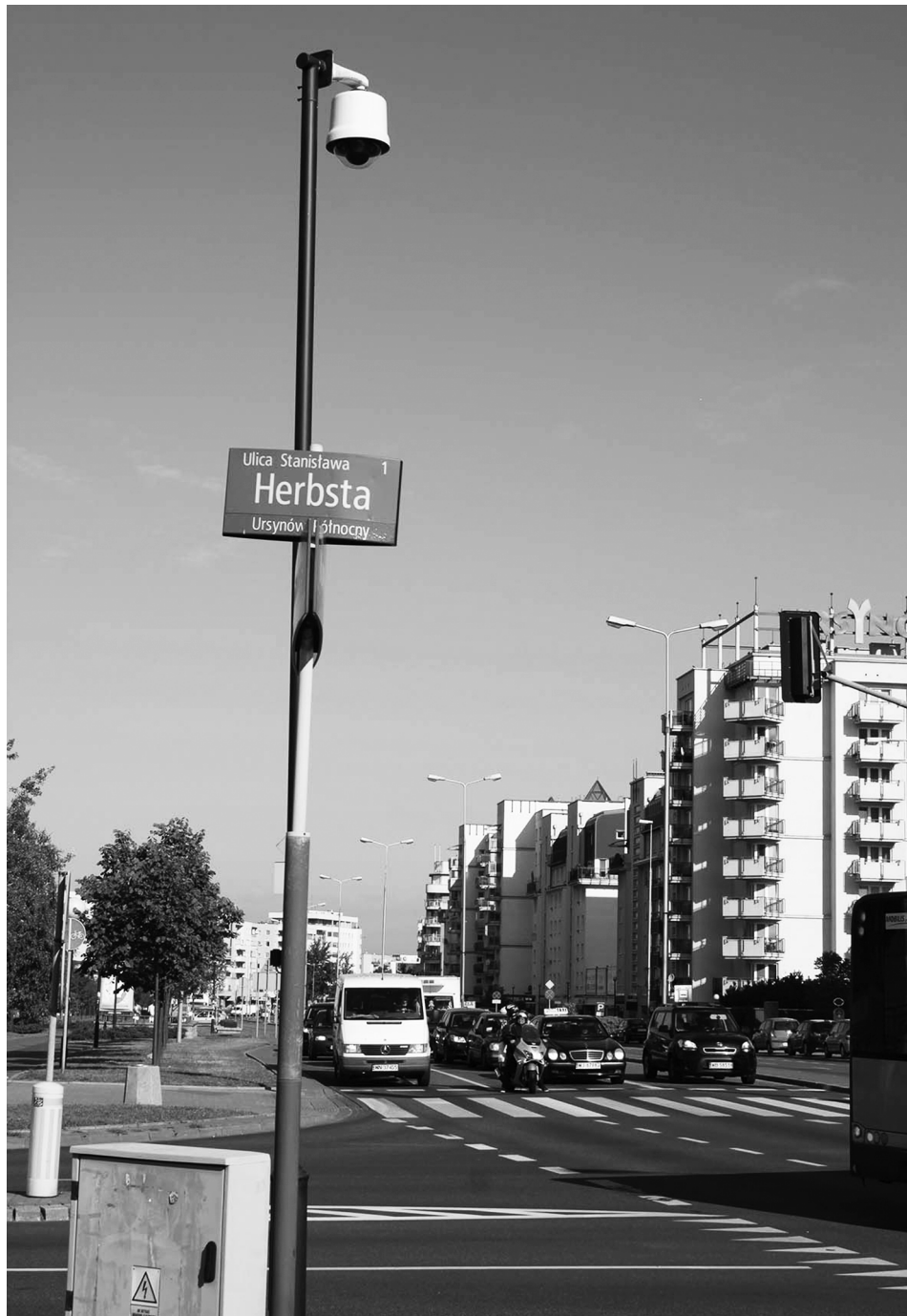
Ulica Stanisława Herbsta w Warszawie