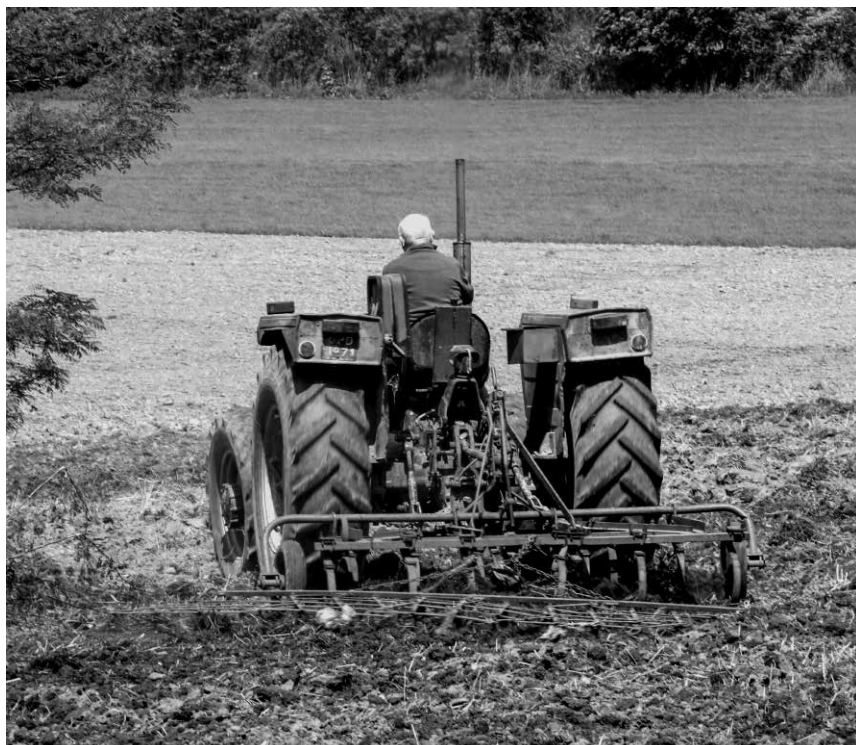
Fot. 11. Uprawa pola przy byłej kopalni węgla „Andaluzja” w Piekarach Śląskich-Brzozowicach-Kamieniu

i plantacyjnego. Wspomniani rolnicy na ogół nie widzą perspektyw w tradycyjnym gospodarowaniu. Produkcja rolna i jej zbyt nie przynoszą oczekiwanych efektów, co w sumie przekłada się na niewielkie dochody. Obserwując wymienionych rolników, nie sposób oprzeć się wrażeniu końca pewnej ery związanej z dawnym statusem rolnika, wartościami społecznymi na wsi i wiarą w odradzające się życie związane z powtarzającym się cyklem wiosny, lata, jesieni i zimy.