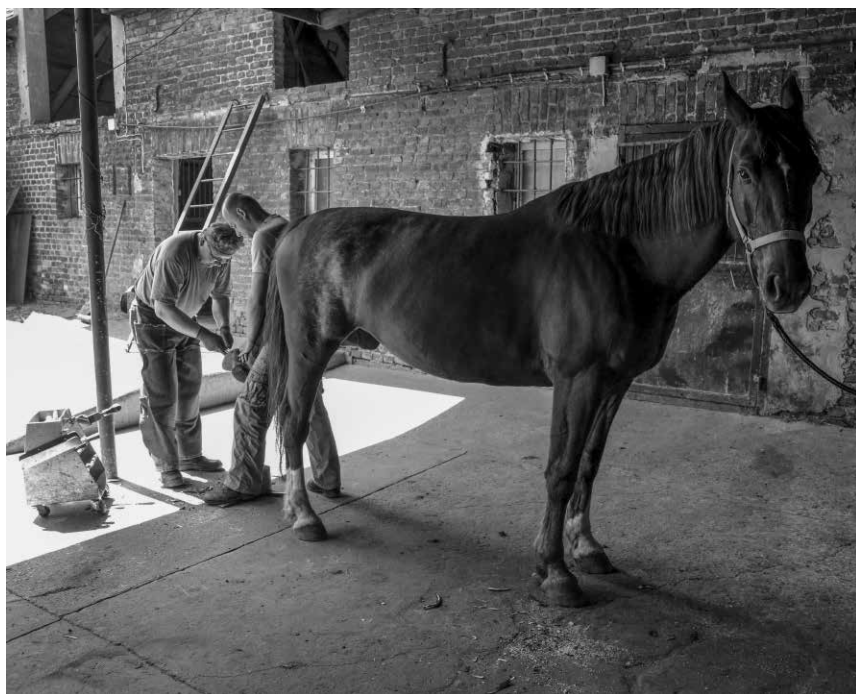
Fot. 8. Czyszczenie kopyta przez Tomasza Fieta – zawodowego podkuwacza

W ramach codziennej pielęgnacji koni należy stworzyć prawidłowe warunki w stajni i na wybiegu: odpowiednią wilgotność w pomieszczeniach i utrzymanie suchej ściółki. Bardzo ważnym zadaniem hodowcy jest systematyczna i okresowa pielęgnacja kopyt: mycie i czyszczenie za pomocą kopytki – powinno się to robić codziennie. Brak higieny powoduje najczęściej gnicie strzałki gąbczastej kopyta. Zaleca się także smarowanie uprzednio oczyszczonych kopyt specjalnym tłuszczem, aby nie stały się kruche 59 .