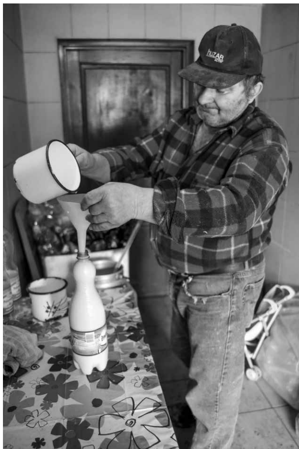
Fot. 4. Rozlewanie mleka do butelek, Piekary Śląskie-Brzozowice-Kamień

Mleko jest produktem spożywczym o pewnych wartościach odżywczych, z którego wytwarza się m.in. sery i masło oraz pozyskuje śmietanę. Jako produkt nietrwały – szybko psujący się, wymaga odpowiednich warunków przechowywania w chłodzie. Kwaśnie mleko powstaje w sposób naturalny: wystarczy surowe pozostawić na kilka dni w temperaturze pokojowej.