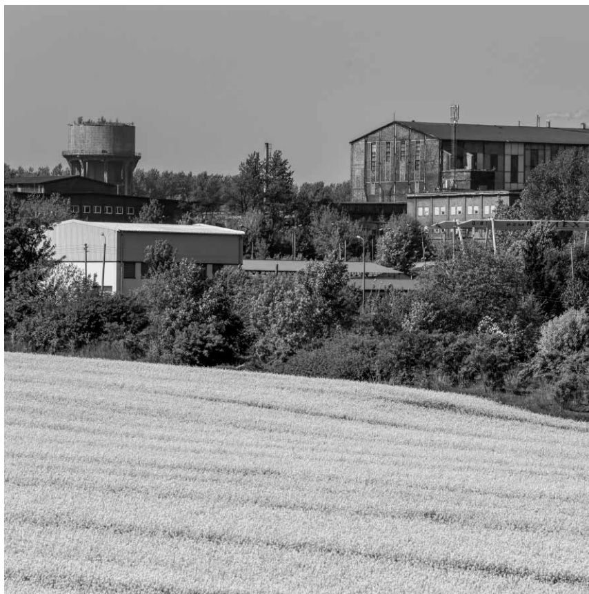
Fot. 1. Pole rzepaku w Chorzowie-Maciejkowicach

a w ostatnich latach ograniczeniu uległo hutnictwo żelaza i górnictwo węglowe 3 . Widocznym śladem dawnej działalności przemysłowej są niewątpliwie zauważalne zmiany w krajobrazie – ziemia (gleba) zniszczona przez przemysł nie została na powrót wykorzystana pod uprawy. Pojawiły się także kolejne zagrożenia dla rolnictwa, jak postępujący proces urbanizacji oraz zmiany w przepisach dotyczących przeznaczania ziemi uprawnej na działki budowlane 4 .