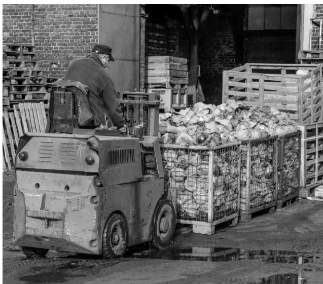
Fot. 6. Ładowanie kapusty wózkiem widłowym, Piekary Śląskie-Dąbrówka Wielka

tu uprawiana „od zawsze”, a przynajmniej od XIX wieku. Panuje opinia, że na takiej ziemi trudno zebrać inne plony, co potwierdzają niejako pruskie rejestry, gdzie jako główną uprawę wymieniano niemal wyłącznie kapustę 43 . Rejon Dąbrówki Wielkiej, dziś dzielnicy Piekary Śląskich, ma długie tradycje rolnicze. Na polach od lat rośnie kapusta, a rolnicy nie zamierzają niczego zmieniać w swoim gospodarowaniu. Ziemia, ciągnąca się wzdłuż pagórków, corocznie zapełnia się sadzonkami. Od razu widać, gdzie wyrosnie biała, a gdzie czerwona główka. Dzięki tej uprawie nie tylko rodziny gospodarzy mają utrzymanie, a także spora grupa ludzi pracujących sezonowo jako siła najemna 44 .