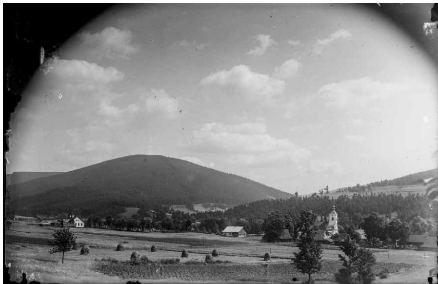
Fot. 3. Brenna-Huta, widok zabudowań gospodarstw powstałych na terenie dawnej huty szkła, w tle kościół parafialny oraz szkoła i cmentarz, ok. 1930 roku

był zobowiązany do odrabiania uciążliwej pańszczyzny. Przynależność do grupy wolnych zagrodników sytuowała Hellerów w miejscowej hierarchii społecznej zaraz po najbogatszych rodzinach siedlaczycy, predestynując ich do odgrywania ważnej roli w życiu miejscowej społeczności.