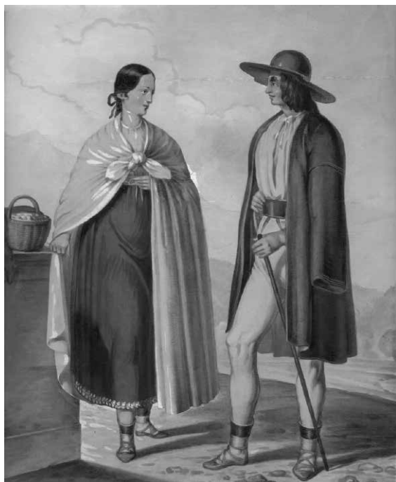
Fot. 2. Górale z Brennej, akwarela Henryka Jastrzembskiego, ok. 1848 roku

puszczy pozyskiwano coraz to nowe tereny pod osadnictwo. Kosztem lasu stawiano domostwa, tworzono pastwiska i pola uprawne.