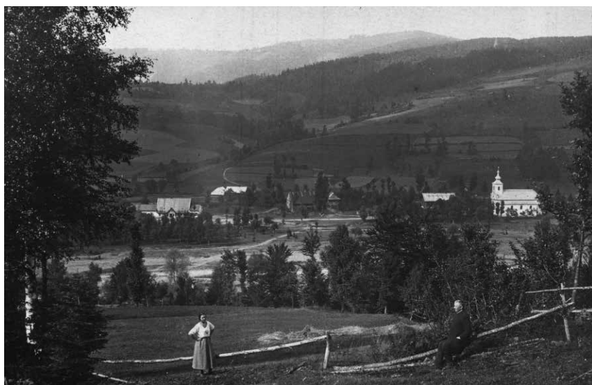
Fot. 5. Widok centrum Brennej, pocztówka, ok. 1914 roku