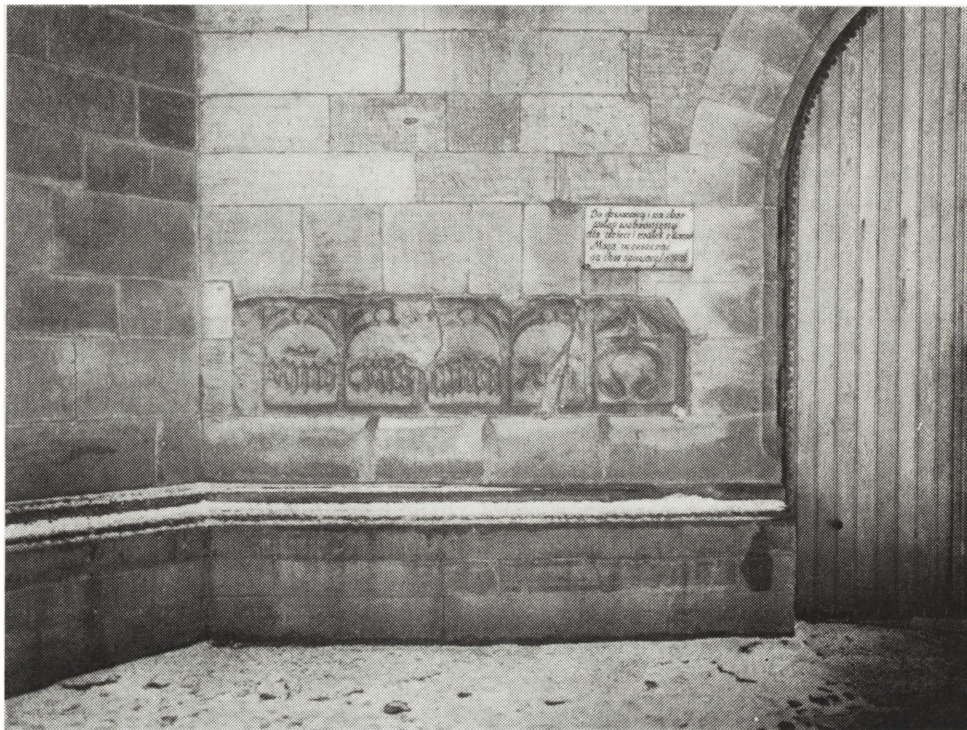
Ryc. 1. Płyta z majuskułowym napisem, pochodząca z nie istniejącego kościoła romańskiego, wmurowana w elewację wieży kościoła parafialnego

o chlebie i wodzie” w areszcie. Regulamin nakazuje zwracać się w sprawach spornych do sądu radzieckiego, a unikać prowadzenia spraw w sądzie grodzkim 31 .