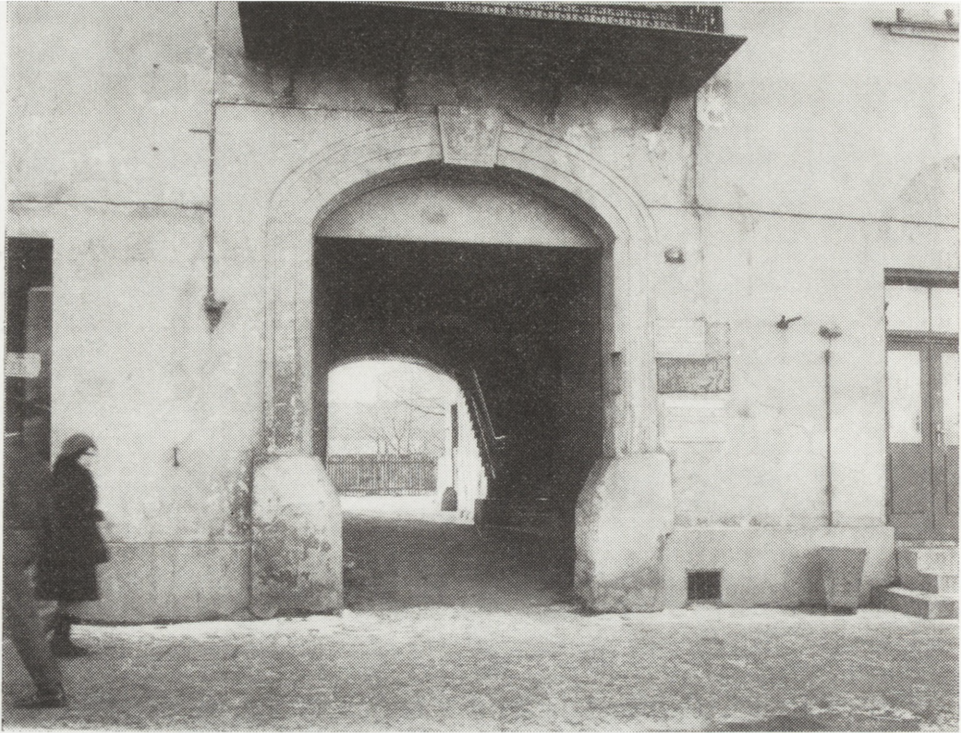
Ryc. 4. Zabytkowa brama w południowej pierzei Rynku