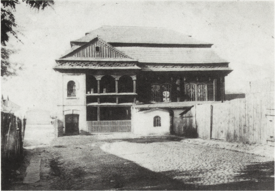
Ryc. 8. Drewniana synagoga z początku XIX w. zniszczona w czasie okupacji hitlerowskiej

nymi i żelazem). Ośrodkami handlu żelazem były również Gowarczów, Szydłowiec i Przedbórz, który w latach siedemdziesiątych XIX wieku wysunął się na pierwsze miejsce pod względem dynamiki rozwoju 56 . Dopiero budowa linii kolejowej z Koluszek do Skarżyska w latach osiemdziesiątych zapoczątkowała dynamiczny rozwój przemysłu w samych Końskich i doprowadziła do jego przekształcenia się z miasta handlowo-żydowskiego w przemysłowo-robotnicze.