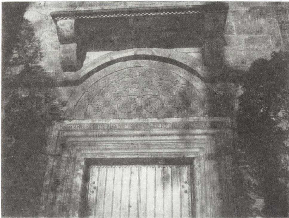
Ryc. 2. Tympanon romański nad portalem kościoła parafialnego

glądu miasta. Trzeba zaznaczyć, że już na przełomie XVII i XVIII wieku nastąpiło przewartościowanie szlaków komunikacyjnych. Dawna droga Wąchock—Żarnów jest już w owym czasie mało uczęszczana, natomiast duże znaczenie uzyskał trakt pocztowy Warszawa—Kraków przebiegający przez Końskie. Nie wpłynęło to jednak na przebudowę miasta, a zwłaszcza jego węzła komunikacyjnego. Główną osią kompozycyjną układu przestrzennego pozostała wspomniana stara droga Wąchock—Żarnów, wzdłuż której nadal koncentruje się budownictwo miejskie. Plac targowy stanowił poszerzenie tej drogi i zarazem punkt centralny miasta.