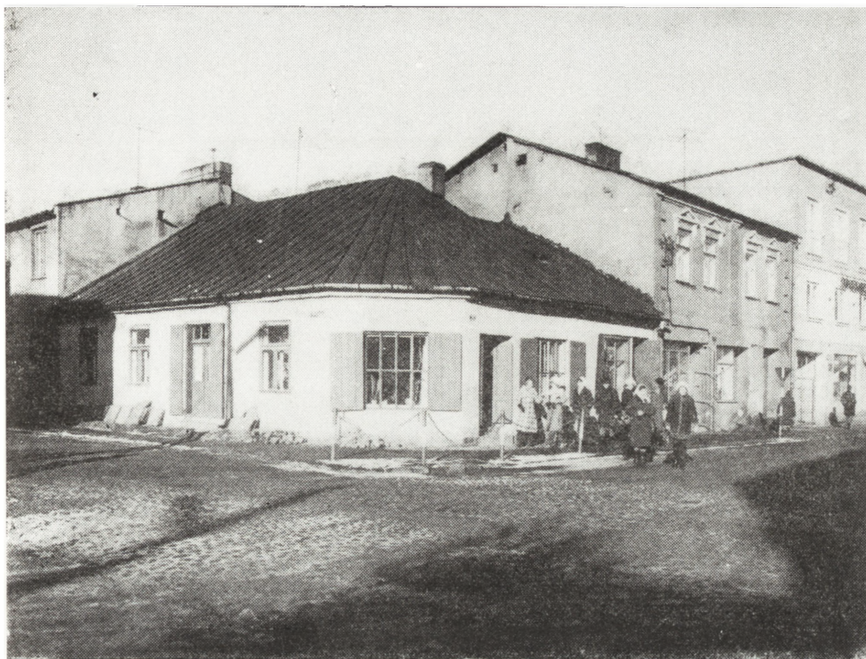
Ryc. 7. Narożnik wschodniej pierzei Rynku i ul. Strażackiej

udział w powstaniu), oraz 419 wsi podzielonych na 18 gmin wiejskich 55 . Pomiędzy drobne regulacje, nie zaszła w granicach powiatu aż do 1915 roku żadna zmiana.