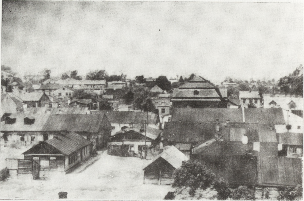
Ryc. 6. Fragment żydowskiej dzielnicy miasta

Kołodziejskiej, Tylnej i Łąki. W mieście były 2 zajazdy, 14 szynków, dwie karczmy, 6 jatek rzeźnych i 2 sklepy masarskie. Znajdowała się też łaźnia wojskowa 54 . Opis wymienia również następujące biura i urzędy: Magistrat, Stację Poczтовую, Sąd Pokoju, Urząd Rejenta Okręgowego, Sąd Policyjny, Urząd Kontrolera Skarbowego, Urząd Rewizora Dochodów, Urząd Nadzorca Magazynów, Komisję Prowiantową, Areszt Detencyjny i Areszt Policji. W Końskich istniały tylko dwie szkoły: szkoła elementarna i szkoła dla dzieci żydowskich (prawdopodobnie przy bożnicy).