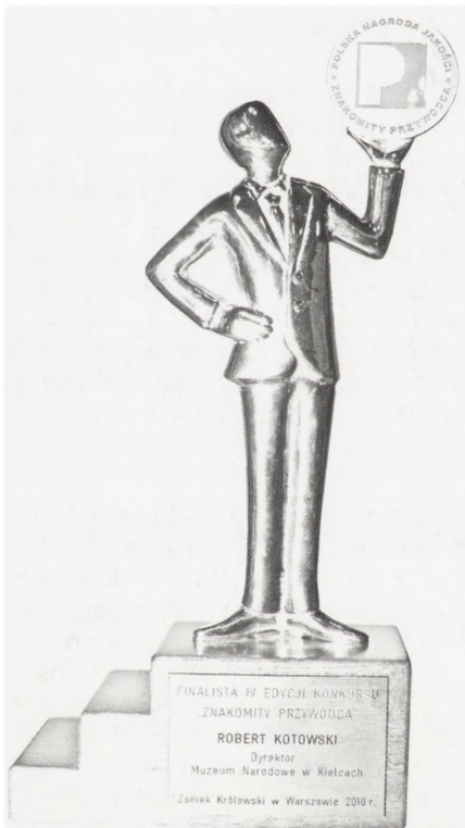
Il. 1. Finalista IV edycji konkursu „Znakomity Przywódca”

Godnym podkreślenia jest fakt, że w 2009 roku, zaledwie kilka miesięcy po certyfikacji systemu zarządzania jakością zgodnie z normą ISO 9001:2008, Instytucja otrzymała wyróżnienie w konkursie Świętokrzyska Nagroda Jakości. Dynamika zmian jest widoczna także dla otoczenia Organizacji. Działania muzealników opierają się na realnej analizie potrzeb i oczekiwań społeczeństwa.