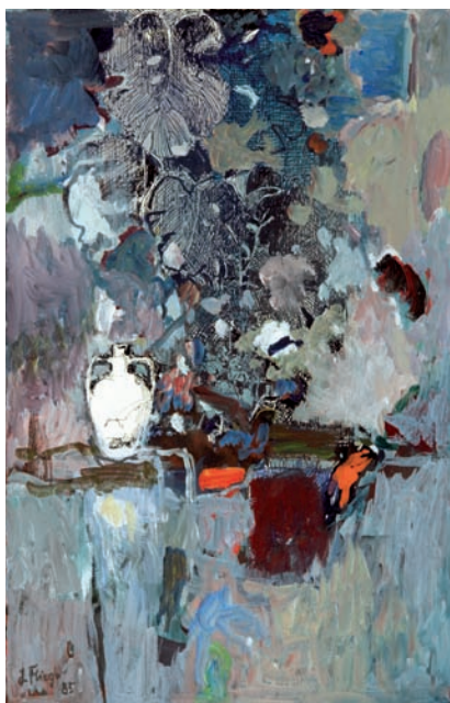
Il. 1, W altanie , 1985

Józef Flieger (1922-1989) W ALTANIE , 1985 Sygn. l.d.r.: J. Flieger/85 Zakup 1988 Akryl, gwasz, tusz, papier Wymiary 48 x 30,6 cm MNKi/W/161