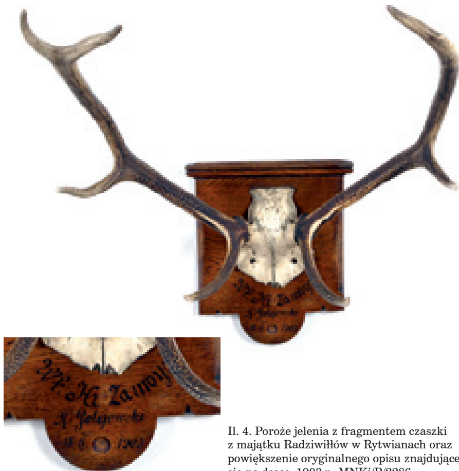
Il. 4. Poroże jelenia z fragmentem czaszki z majątku Radziwiłłów w Rytwianach oraz powiększenie oryginalnego opisu znajdującego się na desce, 1903 r., MNKi/P/2286.

Znaczącą część łowieckiego dorobku kulturalnego mieszczą muzea w całej Polsce, lecz do wyjątkowych pod względem zasobności zbiorów należy Muzeum Łowiectwa i Jeździectwa w Warszawie. Największe zbiory łowieckie znajdują się w rękach prywatnych, z których część posiadają myśliwi.