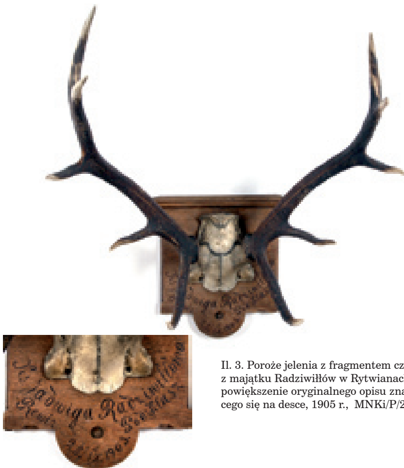
Il. 3. Poroże jelenia z fragmentem czaszki z majątku Radziwiłłów w Rytwianach oraz powiększenie oryginalnego opisu znajdującego się na desce, 1905 r., MNKi/P/2287.

ckiej. W rozległym obszarze niematerialnej kultury łowieckiej mieszczą się zjawiska o zróżnicowanym charakterze: muzyczne, artystyczne, plastyczne, sakralne, językowe, literackie, popularne i masowe. Już od najdawniejszych dziejów ludzkości łowiectwo stanowiło inspirację twórców, która wyrażała się m.in. w łowieckiej tematyce rytów naskalnych i malowideł.