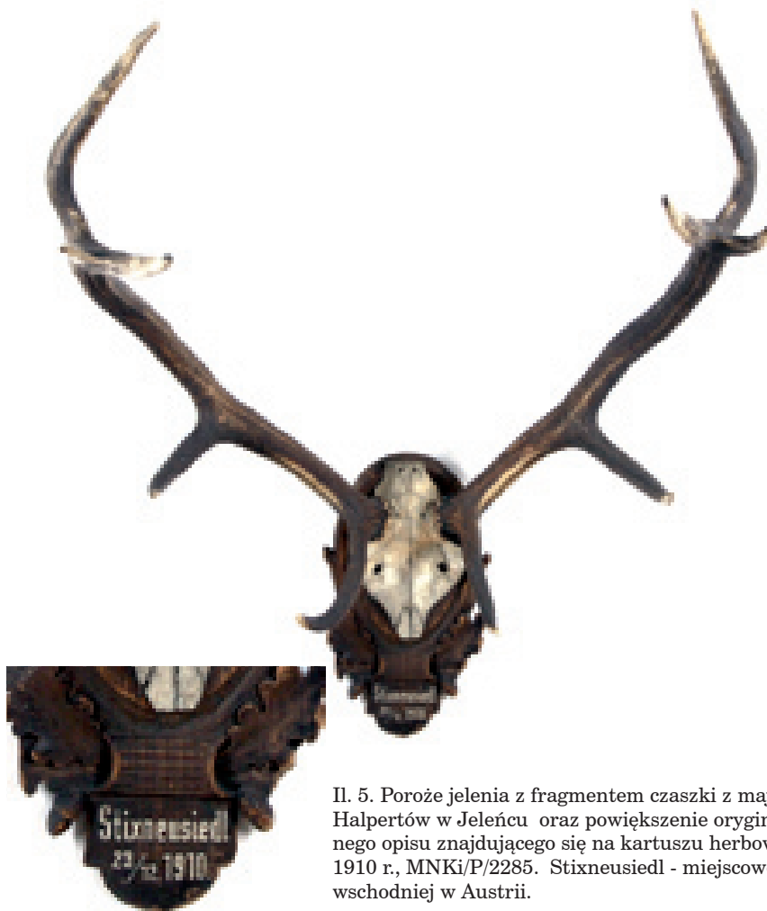
Il. 5. Poroże jelenia z fragmentem czaszki z majątku Halpertów w Jeleńcu oraz powiększenie oryginalnego opisu znajdującego się na kartuszu herbowym, 1910 r., MNKi/P/2285. Stixneusiedl - miejscowość we wschodniej w Austrii.

wana głowa lub przednia część tułowia zwierzęcia. Najbardziej popularne są całe zwierzęta – zazwyczaj są to mniejsze gatunku ssaków i ptaki. Pozostałe to czaszki (lisa, borsuka, jenota), skóry i futra zwierząt, ale również inne, np. pęczek włosów z chytu dzika, włosy czuciowe z lisa czy borsuka, ogony, wybrane zęby niektórych ze zwierząt. Niezwykle efektywnym trofeum jest oręż dzika – szable i fajki, które układa się na okrągłej desce. W przypadku ptaków są to przede wszystkim pióra, przykładowo piórka kaczora, bródka słonki. Część trofeów ocenia się wg międzynarodowej punktacji i nagradzana medalami. Aby przetrwały przez lata, muszą zostać właściwie spreparowane. W polskiej tradycji, podkreśla się odpowiednie przechowywanie i szacunek dla trofeów – są to ważne elementy etyki łowieckiej. Pełnią one również rolę dydaktyczno-badawczą. Niektóre z nich podlegają obowiązkowi znakowania, wyceny oraz ewidencjonowania. Rekordowe okazy podlegają w Polsce ochronie prawnej – mogą być wywożone za granicę jedynie w celu eksponowania ich na wystawach specjalistycznych.