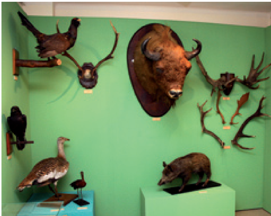
Il. 6. Fragment wystawy przyrodniczej z okazji 100-lecia Muzeum Narodowego w Kielcach. Na zdjęciu m.in. głowa żubra (MNKi/Mat/P/125) i głuszec (MNKi/Mat/P/124) z majątku Wielopolskich w Chrobrzu.

[Il. 7]. Sposób preparacji i wymodelowanie okazów świadczy o dużym kunszcie Bogdana Kiesia z Przyszowic, jednego z najlepszych preparatorów w naszym kraju. Licząca 153 pozycje kolekcja będzie zaprezentowana na stałej ekspozycji przyrodniczej Zwierzęta i kontynenty 19 . Zbiory myśliwskie zawsze stanowiły integralną część kolekcji przyrodniczej w Muzeum Narodowym w Kielcach. W innych przypadkach były one, nie tylko uzupełnieniem istniejących kolekcji ale stawały się załączkiem nowych placówek muzealnych jak np. Muzeum Przyrodniczego im. Krystyny i Włodzimierza Tomków w Ciężkowicach 20 .