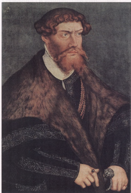
Portret księcia pomorskiego Filipa I pędzla Lucasa Cranacha Młodszego odzyskany z Niemiec w 1998 r.