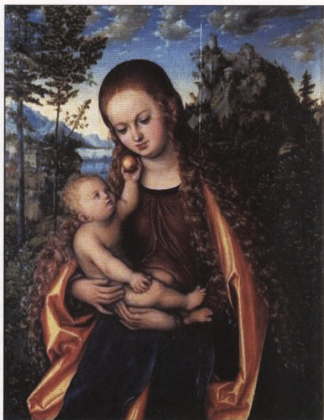
Madonna Głogowska pędzla Lucasa Cranacha Starszego odzyskana z Rosji.

Na drodze dalszych negocjacji rewindykacyjnych z Rosją stała uchwalona 5 lutego 1997 r. przez Dumę (izbę niższą parlamentu Federacji Rosyjskiej) ustawa O prawie własności dóbr kultury, przemieszczonych do Związku Radzieckiego w wyniku drugiej wojny światowej i znajdujących się na terytorium Federacji Rosyjskiej , która uznała wszystkie dzieła sztuki i archiwa zagarnięte przez Armię Czerwoną w II wojnie światowej 123 za własność Rosji (jako swego rodzaju kontrybucja za poniesione w latach 1941-1944 straty w dziedzinie dóbr kultury); ustawodawca dopuszcza możliwość oddania niektórych zawłaszczonych dóbr kultury za pieniężną rekompensatą 124 .