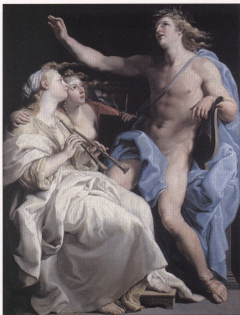
Apolo i dwie Muzy pędzla Pompeo Batoniego odzyskanie z Rosji.