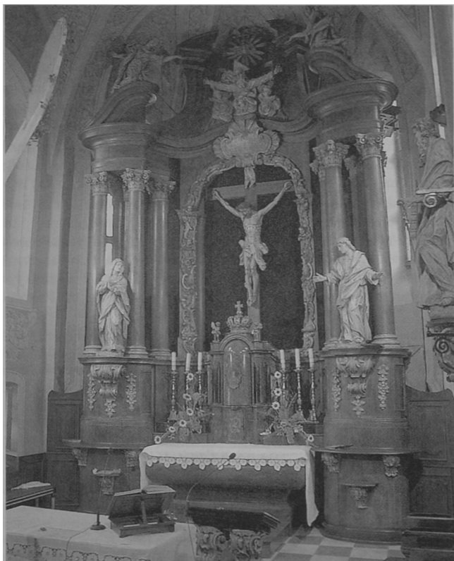
Fot. 2. Toruń – Podgórz, kościół pw. Świętych Apostołów Piotra i Pawła, ołtarz główny.