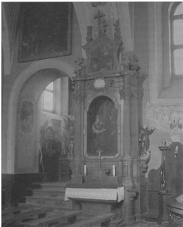
Fot. 3. Toruń - Podgórz, kościół pw. św. Apostołów Piotra i Pawła, ołtarz boczny Zaślubin NMP.