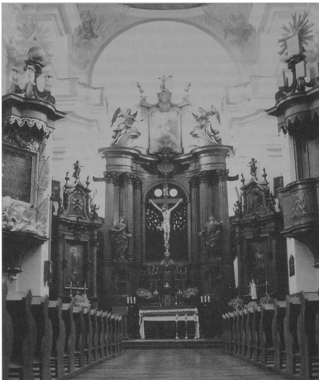
Fot. 1. Boćki, kościół pw. Świętych Józefa i Antoniego, ołtarz główny.