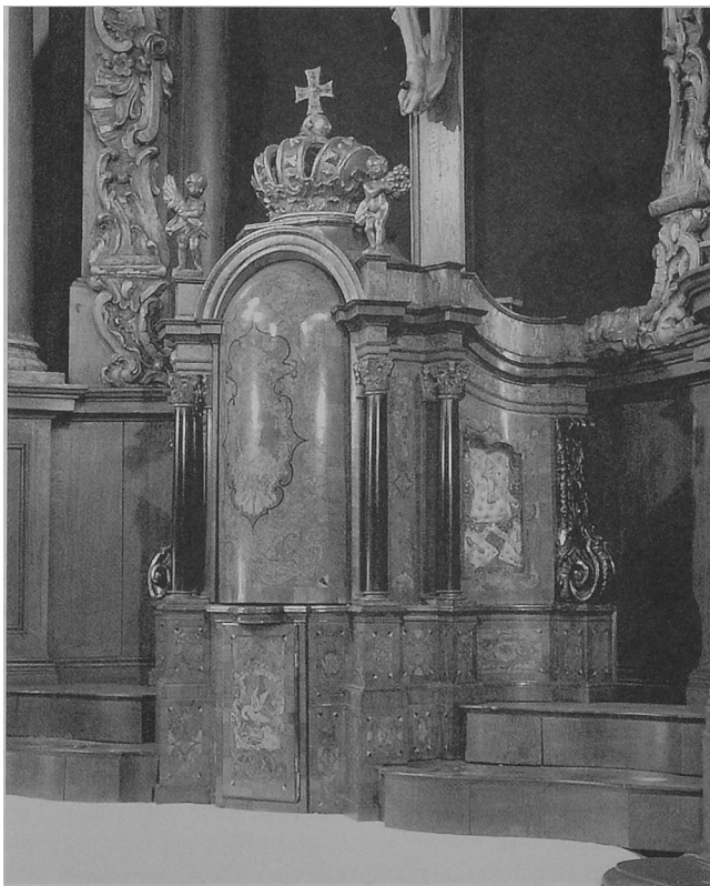
Fot. 4. Toruń - Podgórz, kościół pw. św. Apostołów Piotra i Pawła, tabernakulum w ołtarzu głównym.