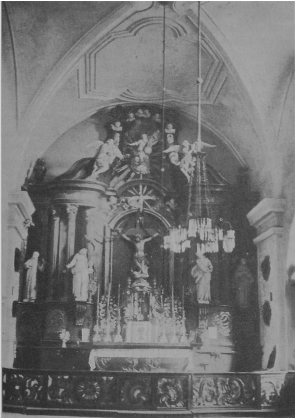
Fot. 5. Łabiszyn, kościół pw. św. Mikołaja, ołtarz główny. Stan po przesunięciu do dobudowanej w 1911 r. nowej części prezbiterium. Spalony wraz z całym wyposażeniem w 1944 r. Oryg.: Archiwum Parafialne Parafii św. Mikołaja w Łabiszynie. Fotokopia: P. Machała