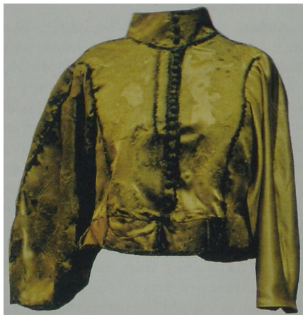
Wams, w którym złożono do grobu kilkuletniego chłopca (po konserwacji i rekonstrukcji)

Zbiory: tymczasowo wams przechowywany jest w Pracowni Dokumentacji i Konserwacji Zabytków Archeologicznych Instytutu Archeologii UMK w Toruniu.