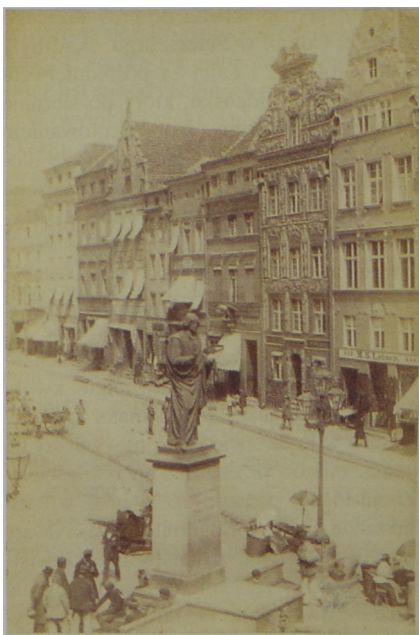
Fot. 6. Pomnik Kopernika, lata osiemdziesiąte XIX w. Fotografia ze zbiorów autorki

15 II 1850 r. Mniejsze sumy (68 talarów) pochłonęły zamówione przez Copernicus-Verein w Berlinie alternatywne wobec projektu Tiecka szkice wykonane przez rzeźbiarza G. Bläsera w 1847 r., 15 V 1851 r. rzeźbiarz Hermann Wittig dostał 25 talarów za astrolabium, drobne zmiany w gotowym już odlewie kosztowały 52 talary. Wykonawca odlewu H. Fischer dostał za swoją pracę 4850 talarów: 8 III 1850 r. przekazano mu 950 talarów, 15 VI 1851 r. 2000, po szczęśliwym dostarczeniu statuy do Torunia 18 II 1852 r. pozostałe 1850 talarów. Bardzo znaczący w porównaniu z odlewem był koszt cokołu, wynoszący łącznie 4145 talarów, w tym jego wykonawcy G. Bungenstabo-