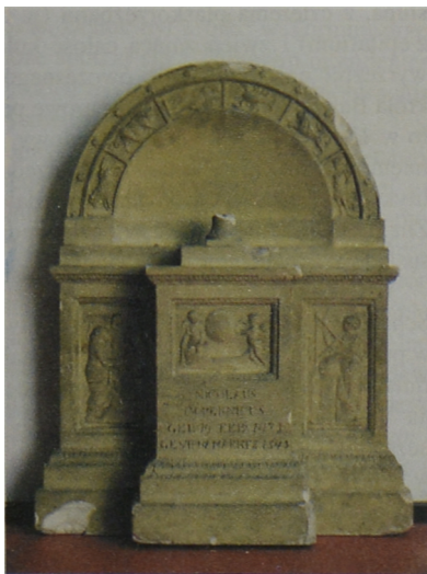
Fot. 2. Johann Gottfried Schadow – projekt pomnika Kopernika z 1806 r. Stan obecny. Astrophysikalisches Institut w Poczdamie

popiersie astronoma. Nie jest do końca jasne, jakie zamiary co do miejsca przeznaczenia miał Schrötter, zlecając Schadowowi zaprojektowanie epitafium, z całą pewnością przeznaczonego dla mniejszej, pruskiej ojczyzny Kopernika; można przypuszczać, że Schroetter miał na myśli Toruń i kościół św. Jana, pisał bowiem o tym Schadow w jednej ze swoich teoretycznych prac, wydanej w 1849 r. 13 Schadow zaprojektował wówczas także inny wariant pomnika, w kształcie ostro-