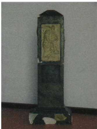
Fot. 3. Johann Friedrich Schadow – projekt pomnika Kopernika z 1806 r. Stan obecny. Astrophysikalisches Institut Poczdam

kilka lat przed jego urodzinami, znalazł się w państwie polskim 20 . Z tego względu, zdaniem tego badacza, niewłaściwe byłoby czynne wspieranie toruńskiej inicjatywy wydawniczej. Dnia 12 IV 1843 r. towarzystwo zostało przez nadprezydenta powiadomione o odmownej decyzji ministra oświaty co do wydania traktatu, natomiast obiecano przyznanie pomocy pieniężnej w przypadku wystawienia pomnika 21 . Dopiero po zawiązaniu się w 1853 r. instytucjonalnej kontynuacji towarzystwa w postaci towarzystwa naukowego Copernicus-Verein für Wissenschaft und Kunst myśl o wydaniu De revolutionibus została ponownie podjęta w związku z jubileuszem urodzin Kopernika w 1873 r. Przygotowane do druku przez profesorów gimnazjum toruńskiego ukazało się w styczniu 1873 r., a w 1879 r. wydano również