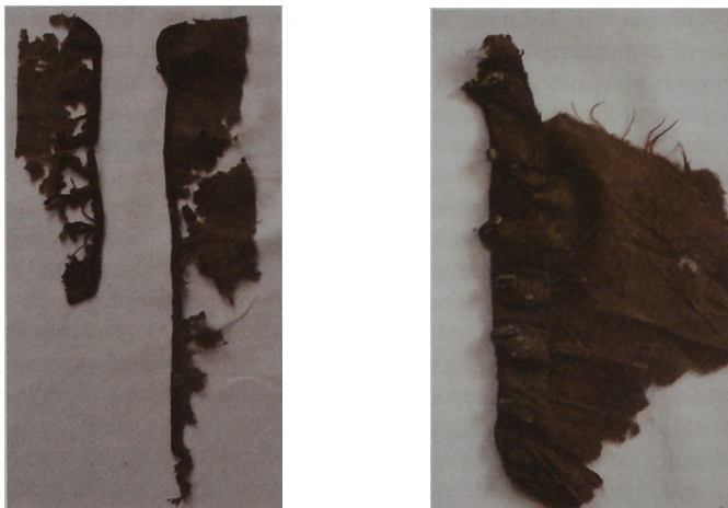
Ryc. 4. Fragmenty jedwabnych koszul wydobytych z krypt w kościele pw. św. Mikołaja w Toruniu

Koszula była najistotniejszym elementem odzieży spodniej. Zmiany, które następowały w jej kroju, uzależnione były w dużym stopniu od zmian, które pojawiały się w kroju okryć wierzchnich. Dlatego też odmienny krój miały koszule, męskie i białogłowskie, oraz te, które zakładano do stroju polskiego i te które ubierano pod ubiór zachodni.