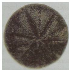
Ryc. 3. Fragment żupana wydobytego w kościele pw. św. Mikołaja w Toruniu; mankiet wykończony „psim uchem” i guzik, na który zapinano rękaw, takie same guziki przyszyte były z przodu żupana

W przypadku omawianego żupana na szczególną uwagę zasługuje sposób, w jaki ozdobiono krawędzie. Nie wykończono ich sznureczkiem, lecz dekoracyjnie przszyto grubszą nicią jedwabną w kolorze tkaniny. W ten sposób powstał bardzo równy, niezwykle starannie