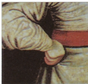
Ryc. 2. Nieznany malarz polski, Portret Janusza Radziwiłła , około 1654, Państwowe Zbiory Sztuki na Wawelu. Rękaw wykończony dekoracyjnie wyciętym mankietem nazywanym „psie ucho”