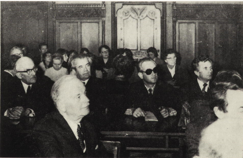
Symposium folklorystyczne Zjazdu. Widok na salę wykładową