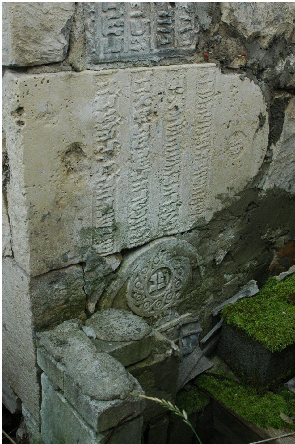
Ryc. 5. Pilica, ściana dostawionej do budynku ubicacji.