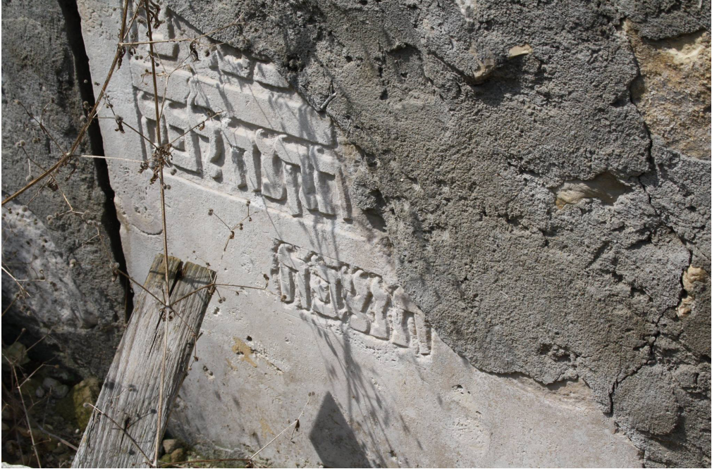
Ryc. 4. Pilica, przykład nagrobka użytego w ścianie.