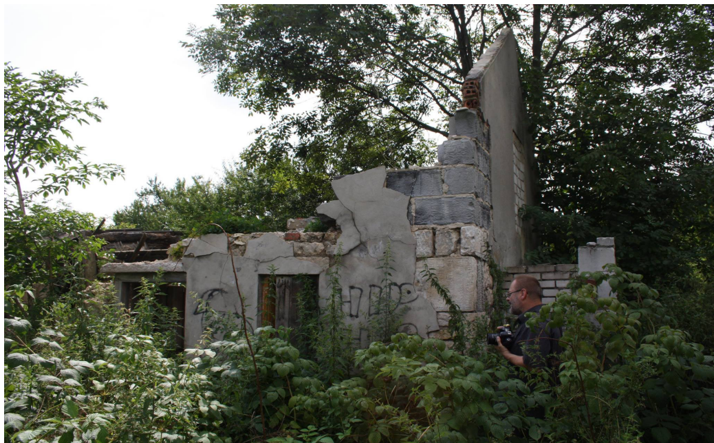
Ryc. 2. Pilica – budynek wzniesiony w z żydowskich nagrobków, stan na 2014 r.