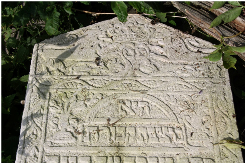
Ryc. 3. Pilica XVIII-wieczny nagrobek.