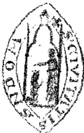
3. Rysunek rzekomej pieczęci Sandomierza (według: M. Gumowski, Najstarsze pieczęcie, tab. 30, nr 381).