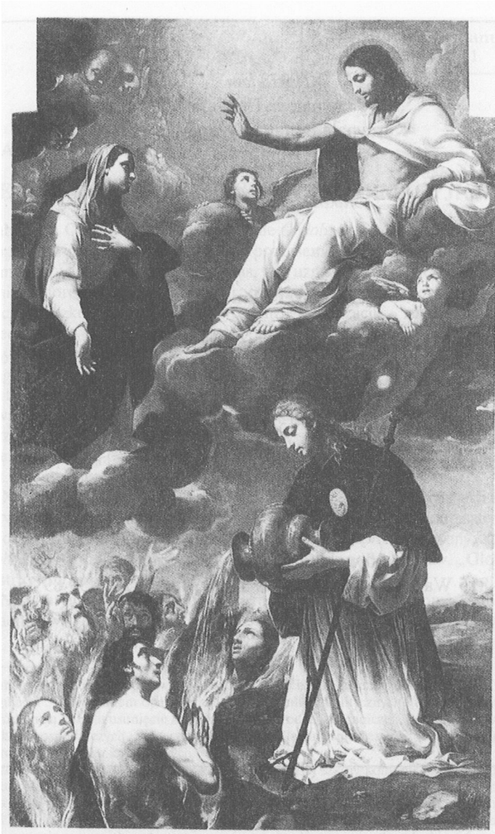
2. Giuseppe Puglia, Święty Wenanty orędownik dusz czyśćcowych, XVII w., Fabriano, katedra S. Venanzo