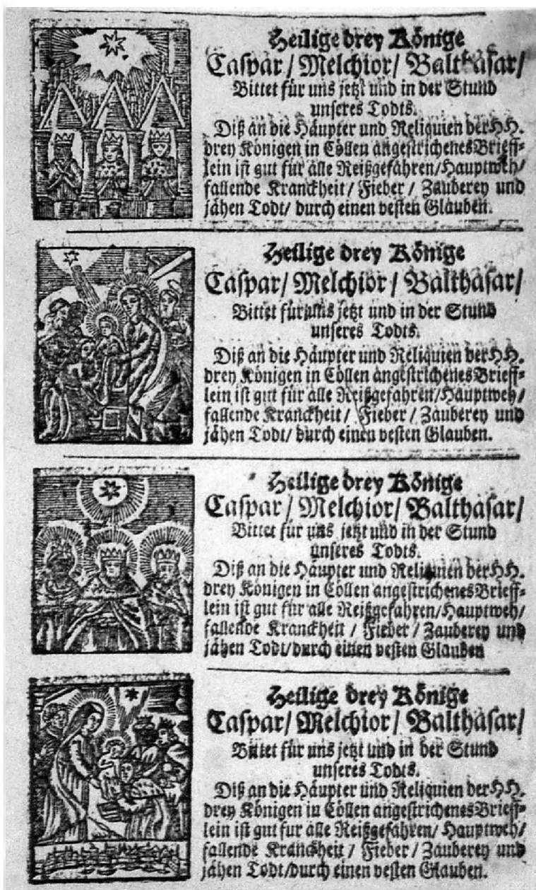
7. Karta zadrukowana czterema egzemplarzami Dreikönigszettel z niemiecką wersją tekstu, 15,5×9,5 cm, Kolonia XVIII w.