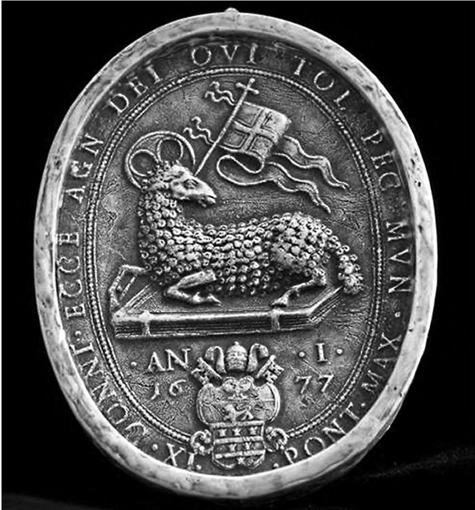
8. Replika medalionu Agnus Dei Innocentego XI z pierwszej edycji w pierwszym roku pontyfikatu 1677 r.