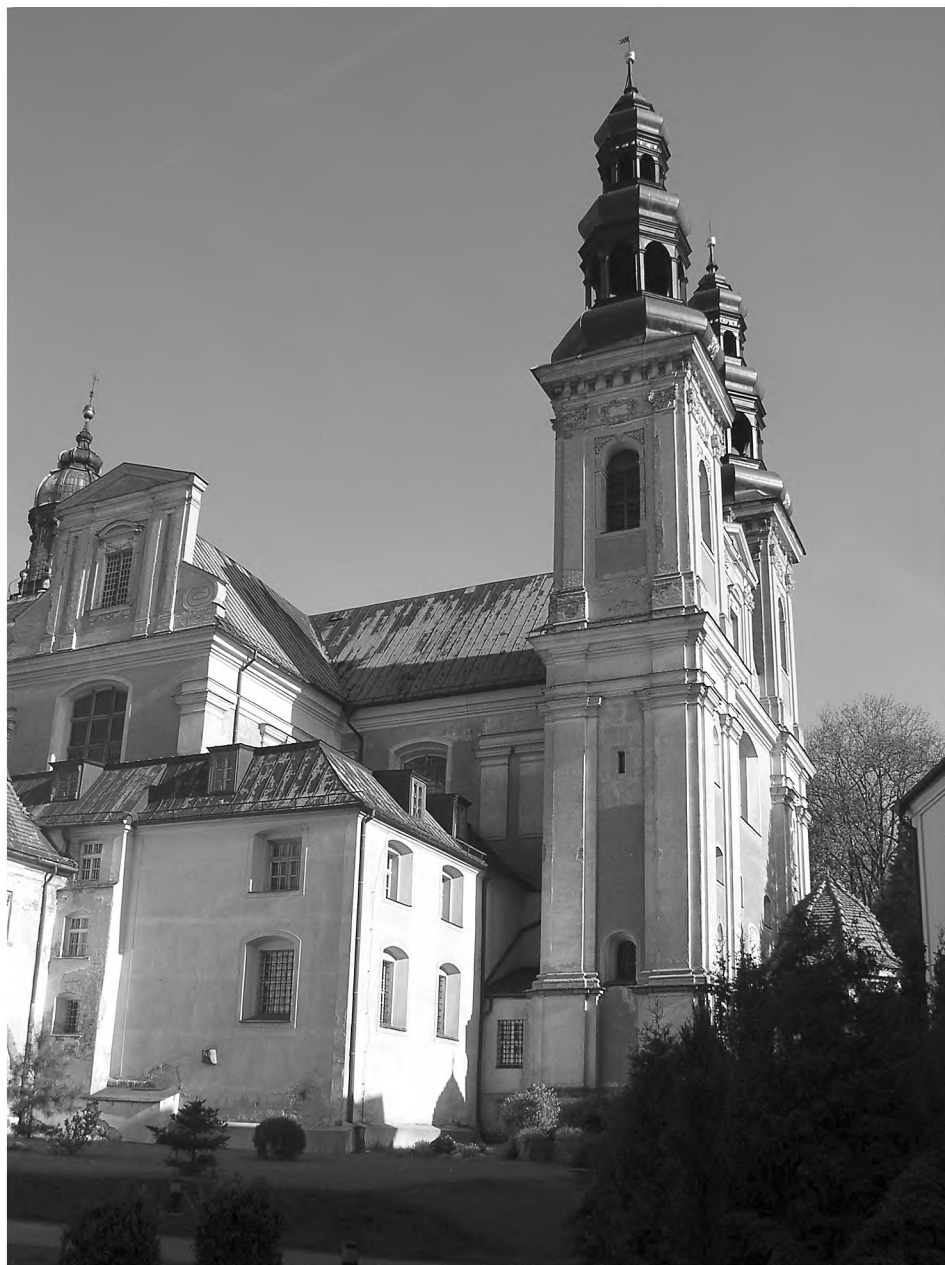
4. Wschodnia partia kościoła w Łądzie z widokiem na wieżę. Fot. autor 2009 r.