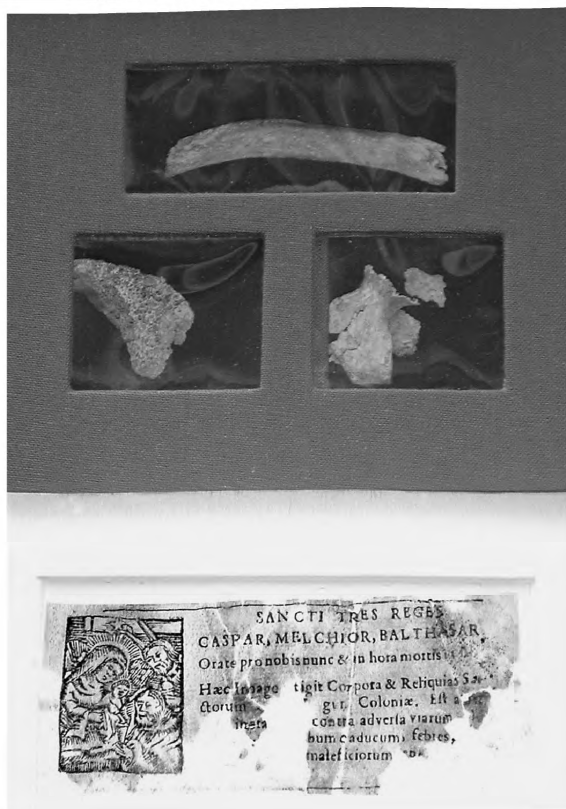
5. Trzy partykuły relikwii Trzech Króli i towarzysząca im karta Dreikönigszettel , stan po konserwacji.