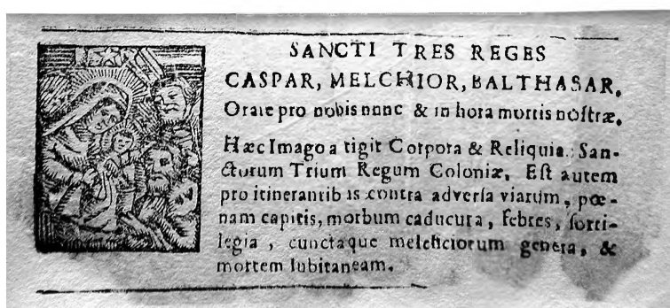
6. Dreikönigszettel z przedstawieniem Pokłonu Trzech Króli , z modlitewnym wezwaniem i objaśniającą inskrypcją, druk na papierze czerpanym, Colonia początek XVIII w., stan po konserwacji.