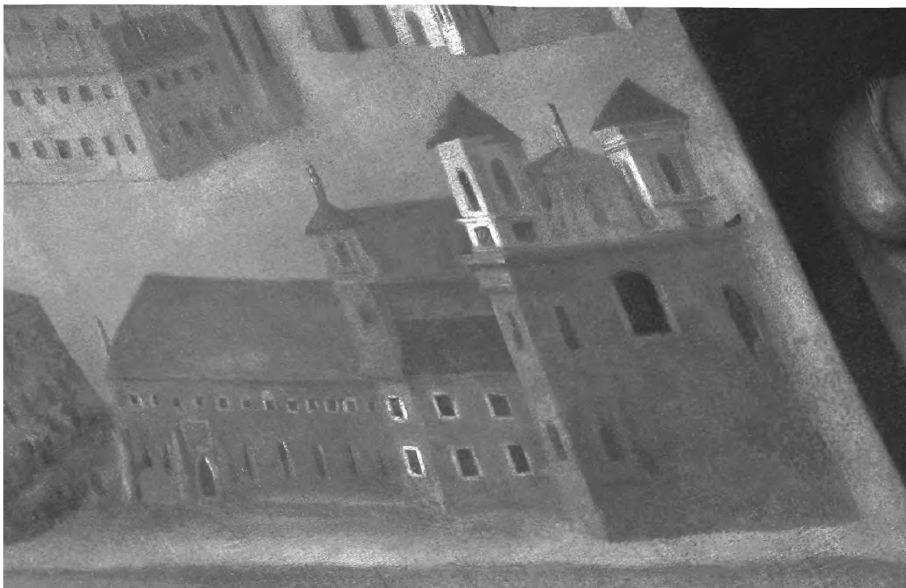
3. Widok klasztoru i kościoła w Łądzie w 1714 r., fragment obrazu Adama Swacha Alegoria rozwoju zakonu cystersów....