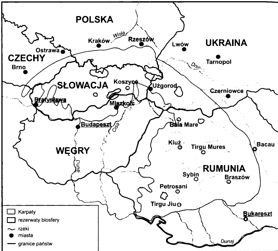
Rys. 1. Rezerwy biosfery w Karpatach.