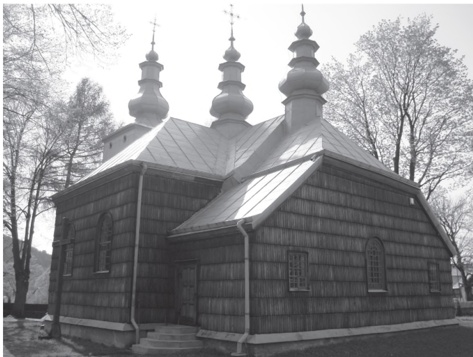
Fot. 3. Bramka wejściowa na cmentarz przy cerkwi w Łosiu.