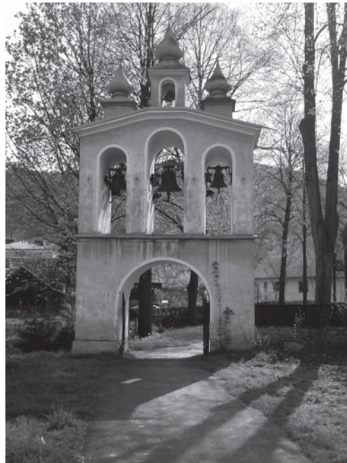
Fot. 2. Dzwonnica przy cerkwi w Łosiu.