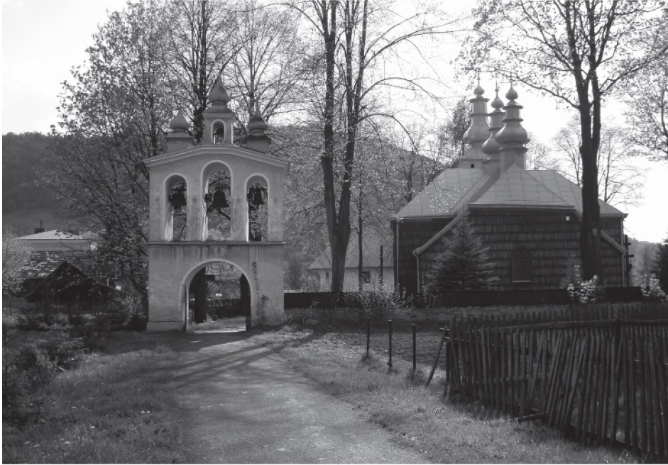
Fot.. 1. Dzwonnica i cerkiew greckokatolicka w Łosiu.