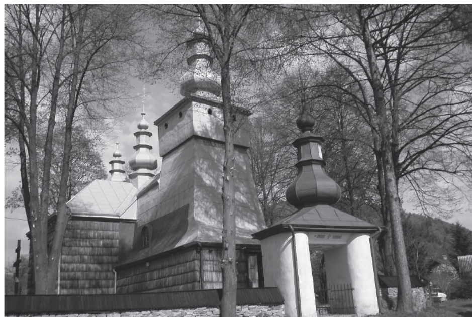
Fot. 4. Cerkiew w Łosiu.