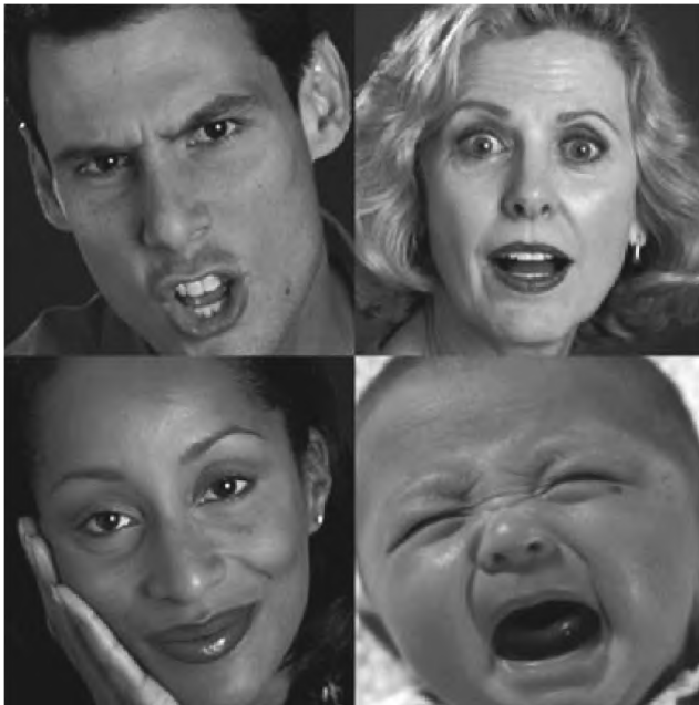
Mimiczne ekspresje emocji

Emocje złożone takie jak miłość, przywiązanie, przyjaźń, współczucie, zazdrość, duma są pochodnymi podstawowych emocji lecz przedłużonych w czasie, a więc trwalej zakodowanymi w pamięci. Wydaje się, że wyewoluowały one jako środek umożliwiający przetrwanie stada, plemienia czy gatunku, gdyż są niezwykle istotne dla sukcesu rozrodczego i życiowego, opieki nad potomstwem, grupowego bezpieczeństwa czy zdobywania pokarmów. ✕worzenie lub odtwarzanie szeroko pojętej kultury, przeżycia estetyczne czy religijne też opierają się na elementarnych emocjach, ale dodatkowo angażują wysoce wyewoluowane korowe struktury mózgu, co nadaje im unikalny, zda się dla ludzki wymiar.