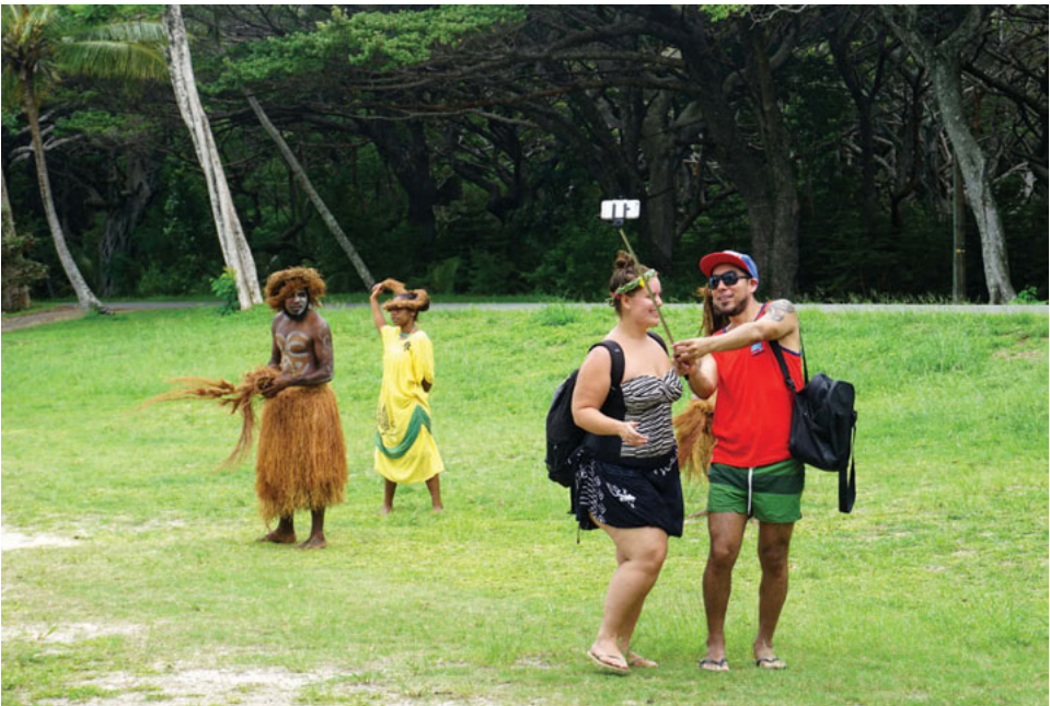
Fot. 2. Na odległość. Miejscowi tancerze oraz australijscy turyści, pasażerowie statku wycieczkowego, zatoka Kuto