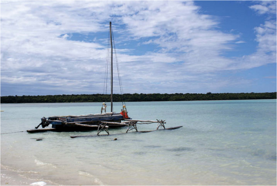
Fot. 1. Tradycyjna piroga w zatoce Saint-Joseph (fot. K. Kania, wrzesień 2014)