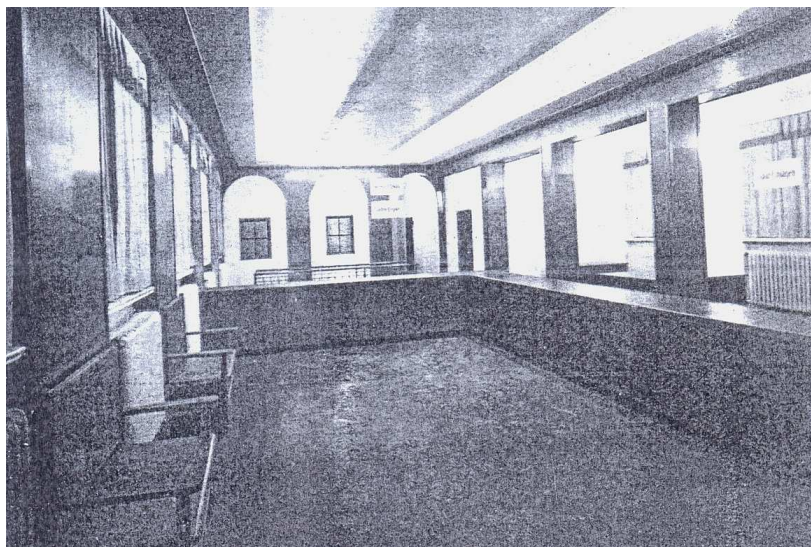
Rysunek 3. Sala operacyjna Miejskiej Kasy Oszczędnościowej ( Stadtsparkasse )