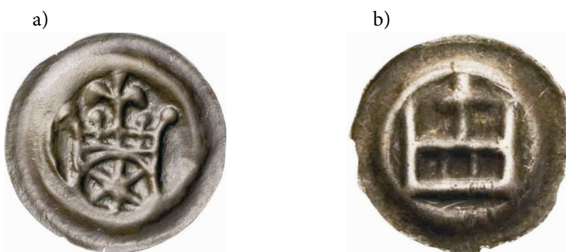
Rysunek 2. Brakteaty krzyżackie:

Jednak w XII wieku ponowne „odkrycie” weksła w okresie wypraw krzyżowych rozpoczęło bankowość europejską. W 1157 r. w Wenecji powstał pierwszy bank, który przyjmował depozyty i udzielał kredytów w formie przekazów w księgach. Kredyt był określony wagą czystego srebra.