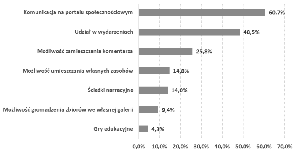
Rysunek 3. Odsetek portali oferujących wybrane formy interakcji pomiędzy twórcami i użytkownikami portali

samorządowych (Sądecka Biblioteka Cyfrowa) i portali powstałych z inicjatywy MKiDN we współpracy z innymi jednostkami (Muzeum-Zamek w Łańcucie). Oznacza to, że strony ze zdigitalizowanymi zasobami kultury nie są w pełni dostępne dla osób niewidomych. Przeprowadzono również test dostępności zasobów audiowizualnych dla osób niesłyszących. Jedynie pojedyncze portale z takimi zasobami posiadają audiodeskrypcję (12 portali, 10,7% stron ze zbiorami audiowizualnymi) oraz napisy dla osób niesłyszących (8 portali, 7,1%).