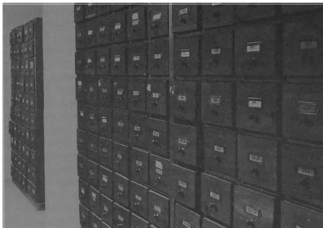
Ryc. 1. Magazyn zbiorów antropologicznych. Szafy z materiałem postkranialnym