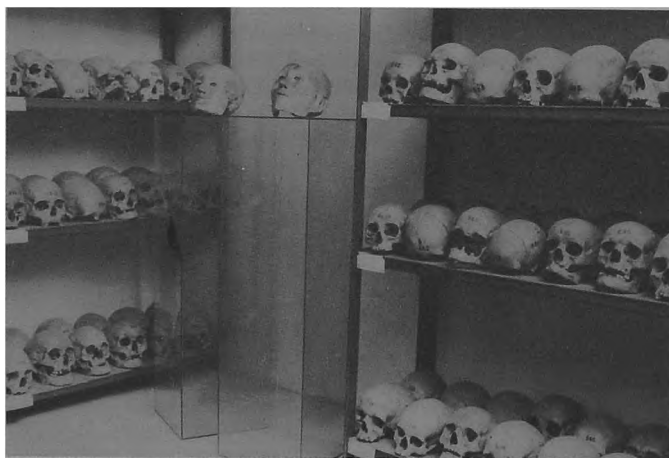
Ryc. 2. Magazyn czaszek