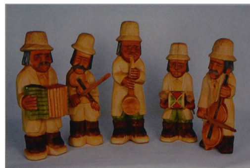
Ryc. 8 Tadeusz Flak, Kapela, rzeźba w drewnie, impregnat, 2004 r., 2005., wys. 31-39 cm