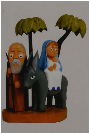
Ryc. 3 Piotr Staszak, Ucieczka do Egiptu, rzeźba w drewnie, polichromia, 2006 r.