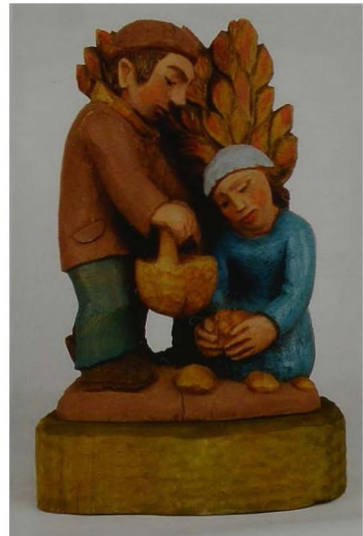
Ryc. 4 Bronisław Suchy, Zbierający ziemiaki, rzeźba w drewnie, polichromia, 1997 r., wys. 39 cm