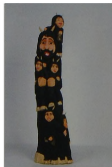
Ryc. 7 Bogdan Osuch, Belzebub, rzeźba w drewnie, polichromia, 2006 r., wys. 70 cm, (foto A. Ziółkowski)