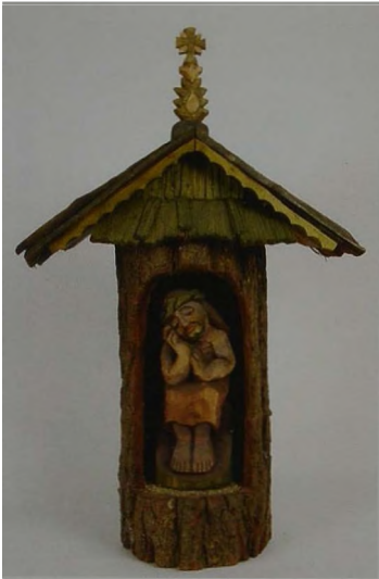
Ryc. 1 Bronisław Suchy, Kapliczka z Frasobliwym, rzeźba w drewnie, polichromia, ok.2000 r., wys. 56 cm