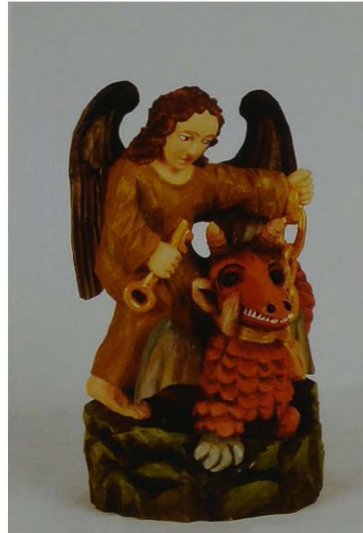
Ryc. 2 Piotr Woliński, Wtrącenie do czeluści, rzeźba w drewnie, polichromia, 2006 r. wys.37 cm