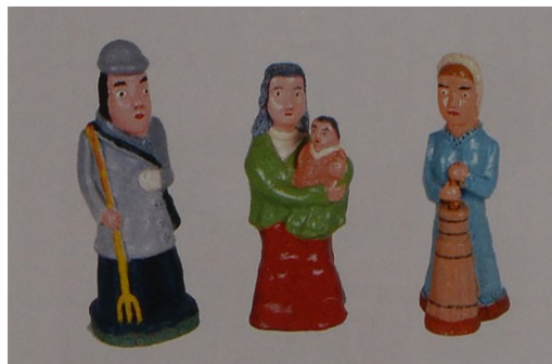
Ryc. 6 Stanisława Matelska, Gosposia masło robi, rzeźba w glinie, polichromia, 1996, wys. 30 cm