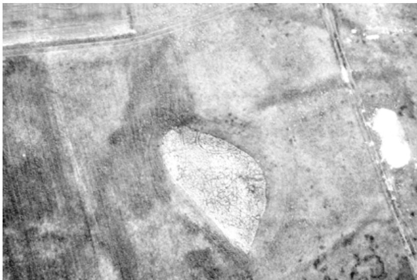
Ryc. 2. Grodzisko w Borkowie, stanowisko 1 Fig. 2. Stronghold in Borkowo. Site 1

w znacznym stopniu zniszczony, co odnotowywano już w pierwszej połowie XX stulecia [KOWALENKO 1938, s. 184]. W zasadzie \frac{2}{3} grodziska zostało zniwelowane [DANIELEWSKI, PAWLIK 2008, s. 125]. Problematyczne wobec tego pozostawało również to, jaka była pierwotna forma grodziska — pierścieniowata czy podkowiasta.