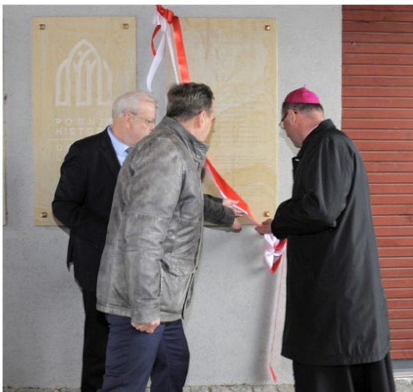
Ryc. 4. Odsłonięcie tablicy pamiątkowej; fot. Jerzy Andrzejewski