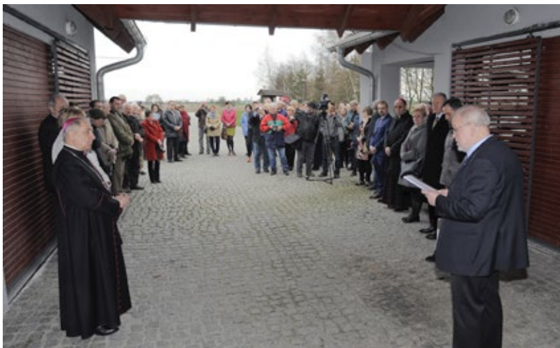
Ryc. 3. Odczytanie preambuły przed odsłonięciem tablicy pamiątkowej