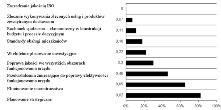
Rys 1. Nowoczesne metody zarządzania i obszary ich zastosowania w urzędach administracji publicznej

W ostatnich latach największy wpływ na zarządzanie w samorządzie lokalnym i regionalnym w krajach zachodnich miały koncepcje New Political Culture oraz local governance. Trendy w funkcjonowaniu samorządów oraz koncepcje tych teorii zostały omówione w artykule P. Swianiewicza 4 , który wskazał także ich wpływ na funkcjonowanie samorządu w Polsce.