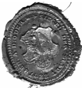
Pieczęć miejska Bytomia Odrzańskiego z XVIII wieku