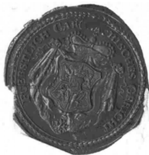
Pieczęć sądu książęcego z XVIII wieku