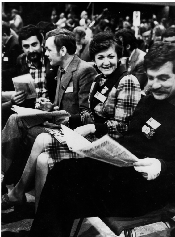
4. Delegaci Regionu Świętokrzyskiego w czasie obrad I Krajowego Zjazdu Delegatów NSZZ „Solidarność” w Gdańsku

wydawnictw antysocjalistycznych, ograniczając się do przejmowania ich przez osobowe źródła informacji 15