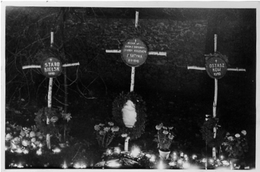
3. Zdjęcie symbolicznych krzyży, ustawionych na cmentarzu partyzanckim przy ul. Ściegienne-go w Kielcach, ku czci pomordowanych w 1940 r. w Starobielsku, Katyniu i Ostaszkowie