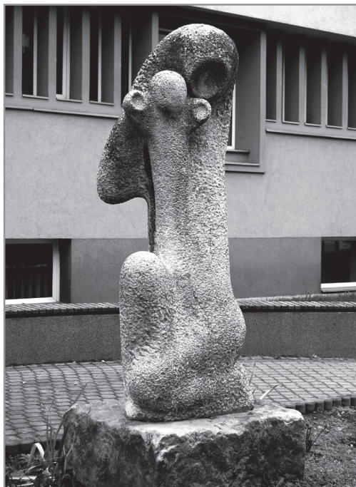
Henryk Burzec (Zakopane), „Macierzyństwo”, kamień, 1966 r., ul. Wesoła, pierwsza rzeźba plenerowa w Kielcach, ofiarowana przez autora podczas „Spotkań rzeźbiarskich 66”