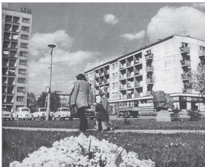
Fragment okładki miesięcznika „Przemiany” (nr 7 z 1974 r.) z fotografią, na której widoczna jest nieistniejąca rzeźba ceramiczna „Rodzina” przywieziona na osiedle „KSM” w 1972 r., wykonana przez Irenę Molin-Sowę w 1966 r. Rzeźba zdobyła złoty medal na I Ogólnopolskim Biennale Rzeźby Plenerowej w Bytomiu w 1969 r.