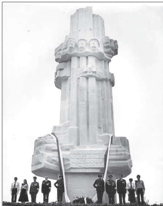
22 lipca 1979 r. odsłonięto pomnik na Kadzielni jako dominujący element obchodów trzydziestopięciolecia PRL