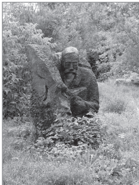
Rzeźba poplenerowa pozostawiona na „Wietrzni”, lata osiemdziesiąte XX w.