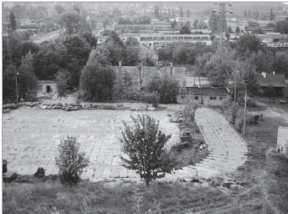
Ośrodek Pracy Twórczej Rzeźbiarzy „Wietrzni”, 2004 r.