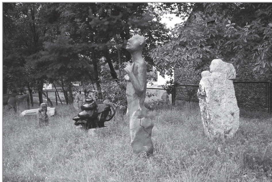
Prace pozostawione przez uczestników plenerów na „Wietrzni”, lata osiemdziesiąte XX w.