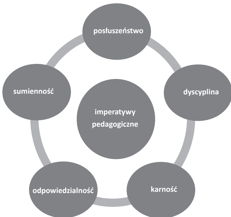
Diagram 1. Imperatywy wychowawcze (oprac. własne)

Wskazane w diagramie nazwy imperatywów wychowawczych mają znamiona synonimów, chociaż w gruncie rzeczy nie są i nie muszą nimi być. Każdemu można przypisać jednostkową treść i w ten sposób ukazać zachodzące pomiędzy nimi różnice.