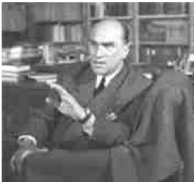
Jarosław Iwaszkiewicz w bibliotece w Stawisku, ok. 1950, zb. Muzeum w Stawisku

W miarę upływu czasu Ukraina staje się dla niego coraz bardziej ziemią egzotyczną, wyjątkową, tajemniczą, która budzi sentymentalne, czule wspomnienia: „to cudowna kraina Gdzieś-Tam” stwierdza w wierszu Na Spasa (1925).