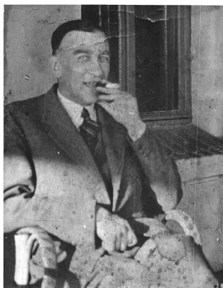
Karol Szymanowski na Stawisku, 1934

W ukraińskim etapie życia Iwaszkiewicz ostatecznie zdecydował o swojej przyszłości jako artysty. Pod wpływem Karola Szymanowskiego porzucił marzenia o karierze kompozytora; dzięki Karolowi Szymanowskiemu utwierdził się jednocześnie w przekonaniu o posiadaniu talentu literackiego, nad którym warto pracować, który należy rozwijać. Pierwsza próba poetycka, wiersz Lilith , opublikowany w kijowskim czasopiśmie „Pióro” (powstały równocześnie z poematem Lilith na dwa fortepiany), zaowocowała w niedalekiej przyszłości zbiorem Oktostychy , zaliczanym do jednych z najlepszych wierszy J. Iwaszkiewicza, po lekturze których Szymanowski napisał: „To jest właśnie ten brak dyletantyzmu, «improwizowania», pewnej ręki w metier, które tak w Tobie cenię” 11 .