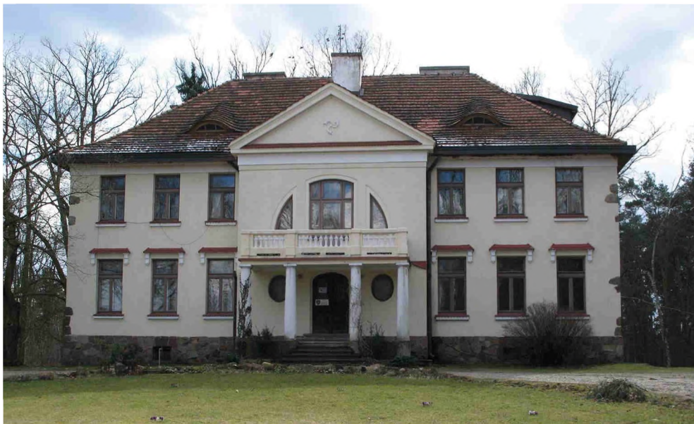
Stawisko, stan obecny

Polskie Mazowsze, które stało się jego miejscem na ziemi od 1918 roku do końca życia – przywodzi stale rozmaite skojarzenia z krajobrazem ukraińskim; równiny mazowieckie porównuje z naddnieprzańskimi stepami, Kijów z Warszawą. Od 1928 r. najważniejszym miejscem na ziemi dla Jarosława Iwaszkiewicza stało się Stawisko; dom, wraz z otaczającym go parkiem leśnym, znajdujący się 25 km od Warszawy, w którym zamieszkał wraz z żoną i córkami.