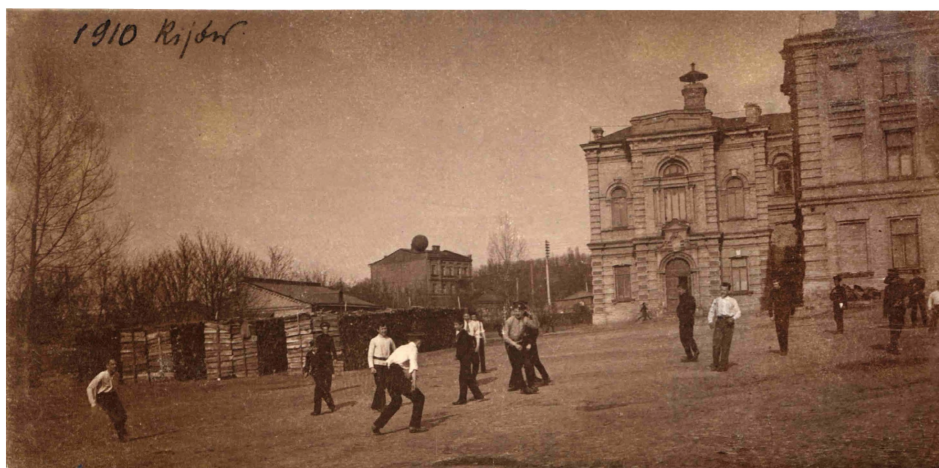
Jarosław Iwaszkiewicz na dziedzińcu gimnazjum w Kijowie, 1910

W Elizawetgradzie i Kijowie uczęszcza do szkół i na uniwersytet, stawia pierwsze kroki w literaturze, marzy o karierze pianisty i kompozytora, próbuje swoich sił jako scenarzysta i aktor teatralny.