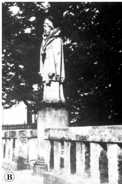
Statua św. Jana Nepomucena na olsztyńskim moście na Łynie. A — po odsłonięciu w 1869 r.; B — po przestawieniu na obrzeże mostu w 1909 r.; C — po restytucji i odsłonięciu 25. lipca 1996 r.