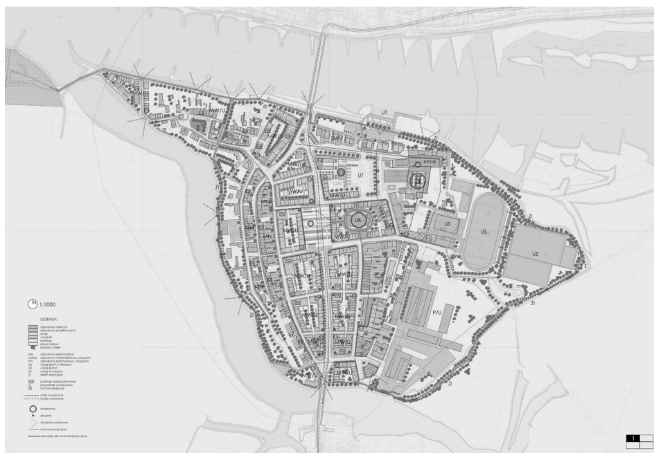
Rysunek 2. Krosno Odrzańskie – koncepcja programowo-przestrzenna