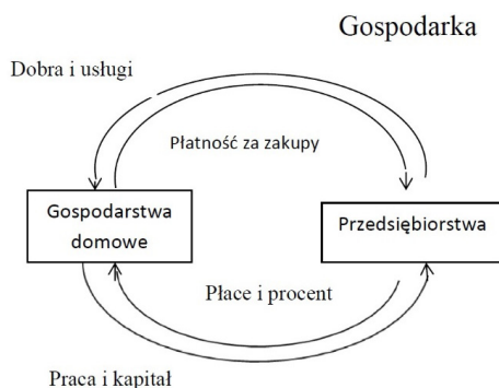
Rysunek 1. Gospodarstwo domowe w systemie gospodarki narodowej