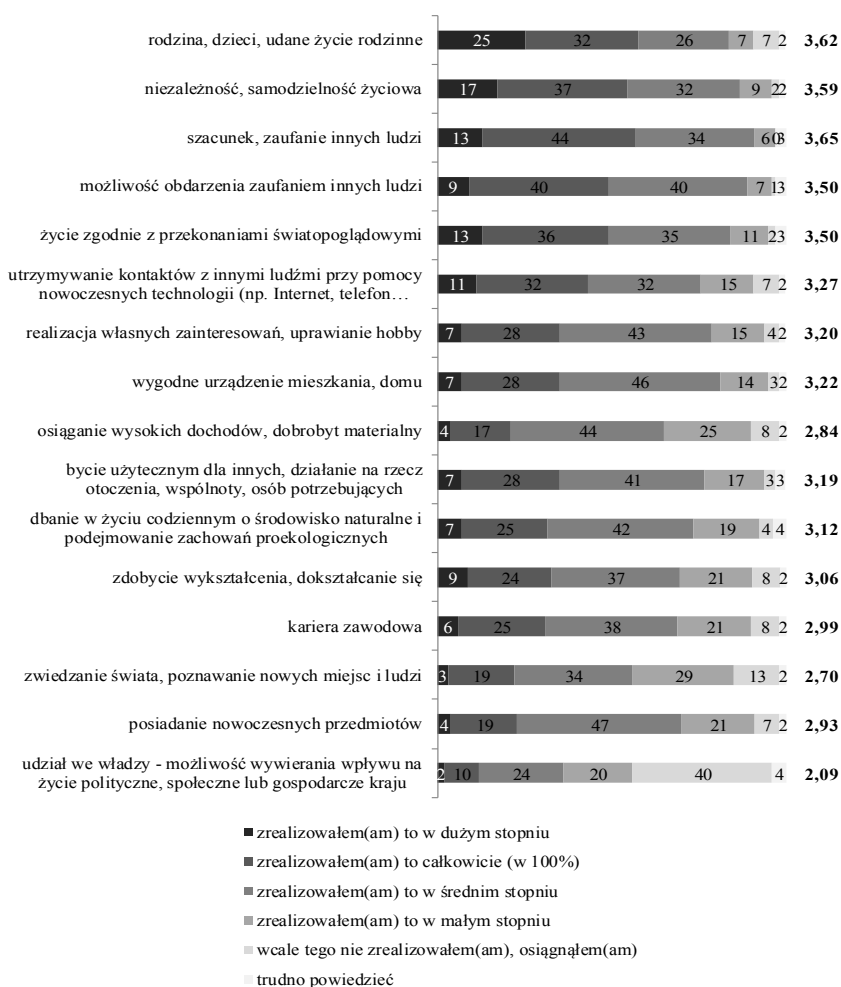
Rysunek 1. Stopień realizacji potrzeb i celów życiowych konsumentów [% wskazań i średnia ocena stopnia realizacji celów konsumentów]