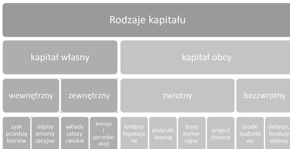
Rysunek 1. Źródło pochodzenia kapitału

Wraz z rozwojem gospodarczym kraju rozwija się rynek nieruchomości. Powstają nowe osiedla mieszkaniowe, kampusy akademickie, ośrodki przemysłowe, biurowce i apartamentowce. Aby sprostać rosnącemu popytowi na nieruchomości, powstają nowe podmioty gospodarcze zajmujące się obsługą tego sektora. Rosnąca skala inwestycji i zasięg działania uczestników tego rynku determinuje fakt powstawania nowych metod finansowania inwestycji. Metody i rodzaje finansowania rozwoju rynku nieruchomości możemy podzielić z uwagi na wielorakie kryteria. Podstawowym i najlepiej charakteryzującym źródła finansowania podziałem jest charakterystyka poprzez źródło pochodzenia kapitału. Wyróżniamy podstawowe grupy: kapitał własny oraz obcy (Michalak, 2007, s. 68–69).