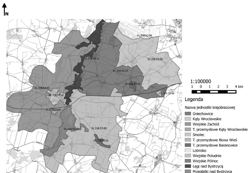
Rysunek 2. Jednostki krajobrazowe na terenie gminy Kąty Wrocławskie