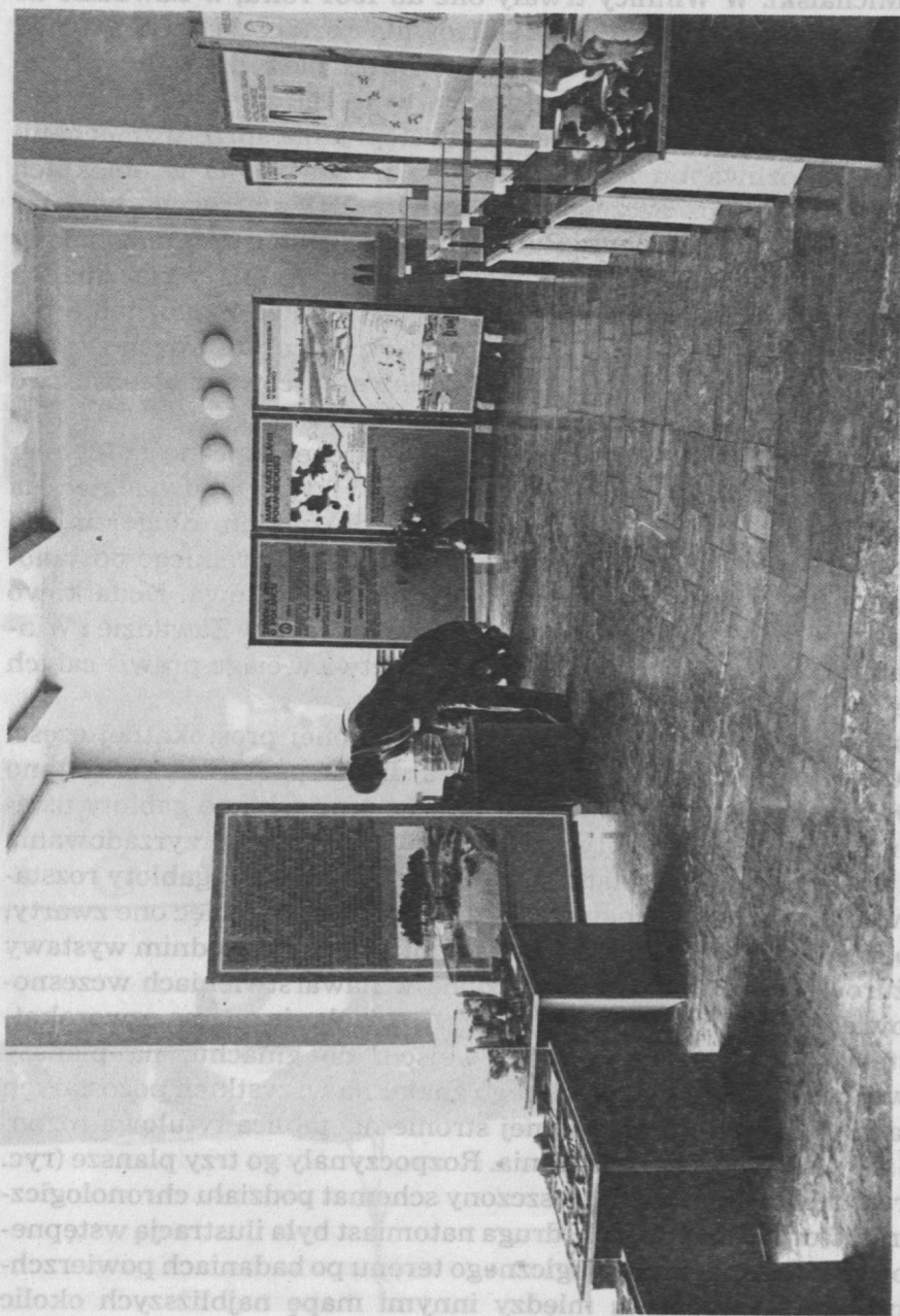
Ryc. 2. Widok głównej części wystawy