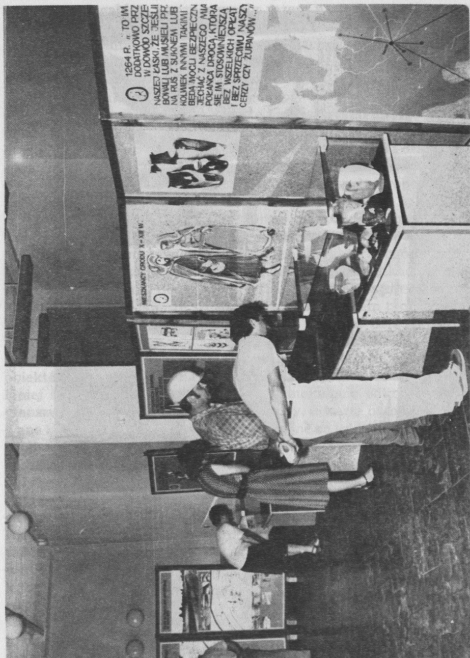
Ryc. 5. Zwiedzanie wystawy przez zaproszonych na jej otwarcie gości

niu z obecną zabudową przemysłową tego obszaru. Plansza czwarta b