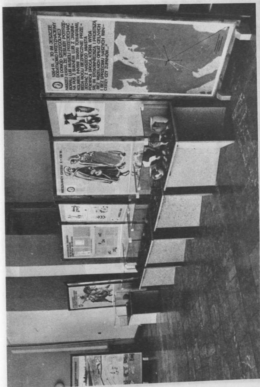
Ryc. 4. Końcowa część wystawy