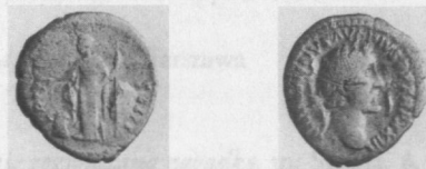
Fig. 3. Denar Antonina Piusa, Fot. M. Dąbski.

Av.: ANTONINVS AVGPVSPTRPXXIII Głowa w wieńcu laur. w pr. Rv.: SA[LVSAVG CO]SIII lub SA[LVTIAVG CO]SIII Salus stoi zwrócona w l., karmi l. ręką węża owiniętego wokół ołtarza, w pr. uniesionej trzyma berło RIC III, s. 63 nr 304 lub 305.