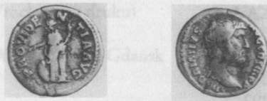
Fig. 2. Denar Hadriana, Fot. M. Dąbski

Av.: HADRIANVS AVGCOSIIIPP Głowa w pr. Rv.: PROVIDE N TIAAVG Providentia stoi zwrócona w l., wskazuje l. ręką na glob, w pr. opartej o kolumnę trzyma berło RIC II, s. 370 nr 262.