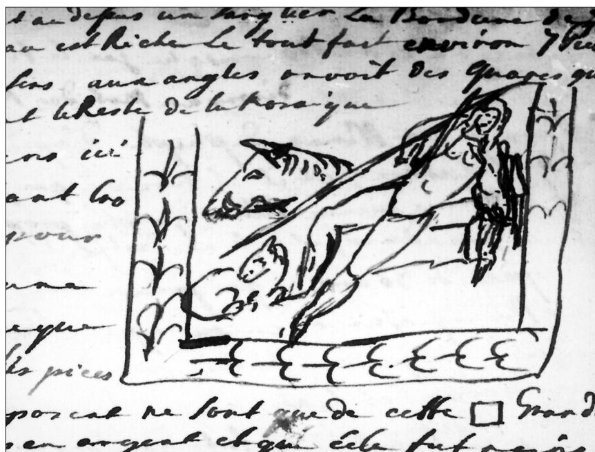
Fig. 2. Mozaika z Nimes, Panneau centralne: Diana na dziku. Rysunek A. F. Moszyńskiego (Cahier II, p. 26).