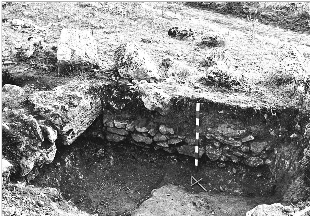
Fig. 2. Урочище Кавказ. Шурф А Fig. 2. Kavkaz near Sevastopol. Trial trench A