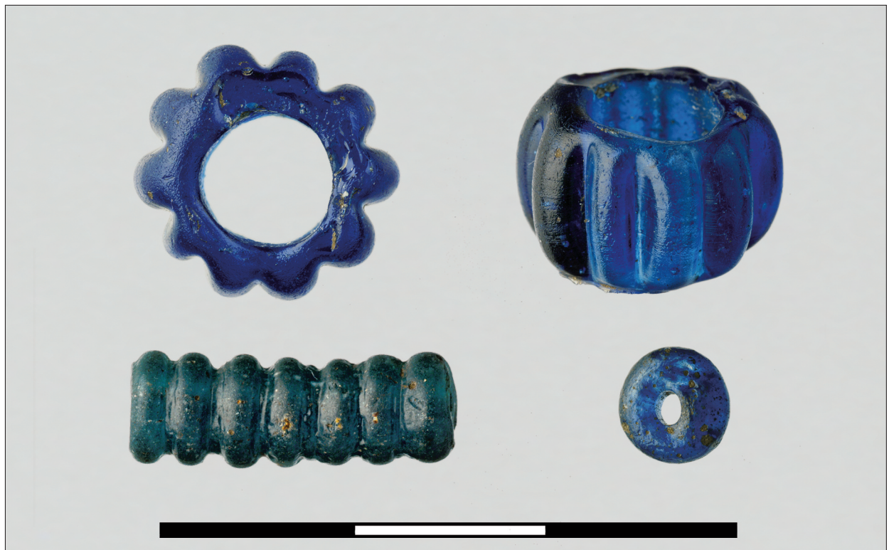
Ryc. 2. Truszkach-Zalesie, st. 4 – osada „Nikienki”. Paciorki szklane.