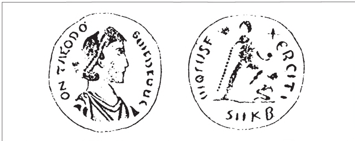
Ryc. 3. Szkic monety z Błędowa; skala nieznana, zgodna z publikacją źródłową (wg VON HIRSCHFELDA 1877: tabl. IX:1a).