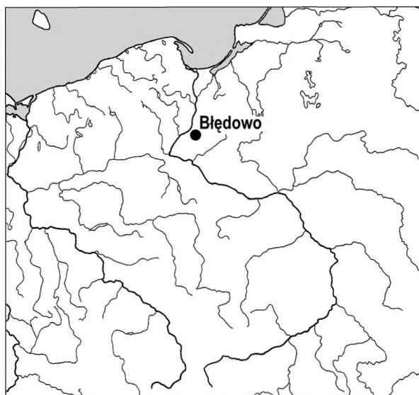
Ryc. 1. Lokalizacja miejscowości Błędowo, pow. wąbrzeski.

Krąg kamienny reprezentował konstrukcję znaną z obszaru kultury wielbarskiej z okresu wpływów rzymskich (KMIECIŃSKI 1962: 93; WOŁĄGIEWICZ 1977: 43; 1981a: 175–176, ryc. 55; WALENTA 1981: 45–48). W systematyce R. Wołągiewicza odpowiadał on odmianie 1, grupy A, a więc kręgom z głazami nieobwarowanymi mniejszymi kamieniami (WOŁĄGIEWICZ 1977: ryc. 24; 1981a: 175). Spośród większości obiektów tego typu wyróżniał się on rozbudowaną konstrukcją w środku koliska, gdzie zazwyczaj znajdowało się od 1 do 4 wolnostojących głazów.