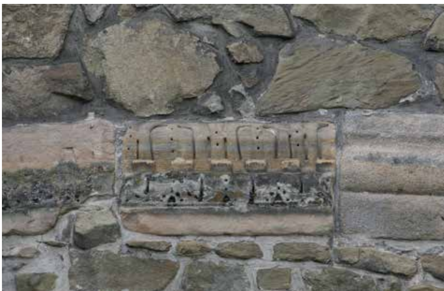
Илл. 7. Чхов, остатки декорированного вала первого костела