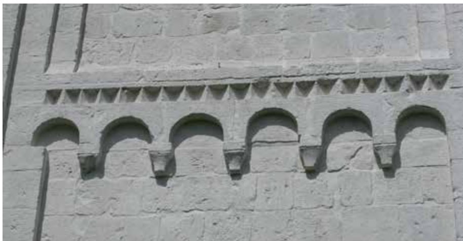
Илл. 4. Церковь Бориса и Глеба, Кидекша, аркатура на середине высоты