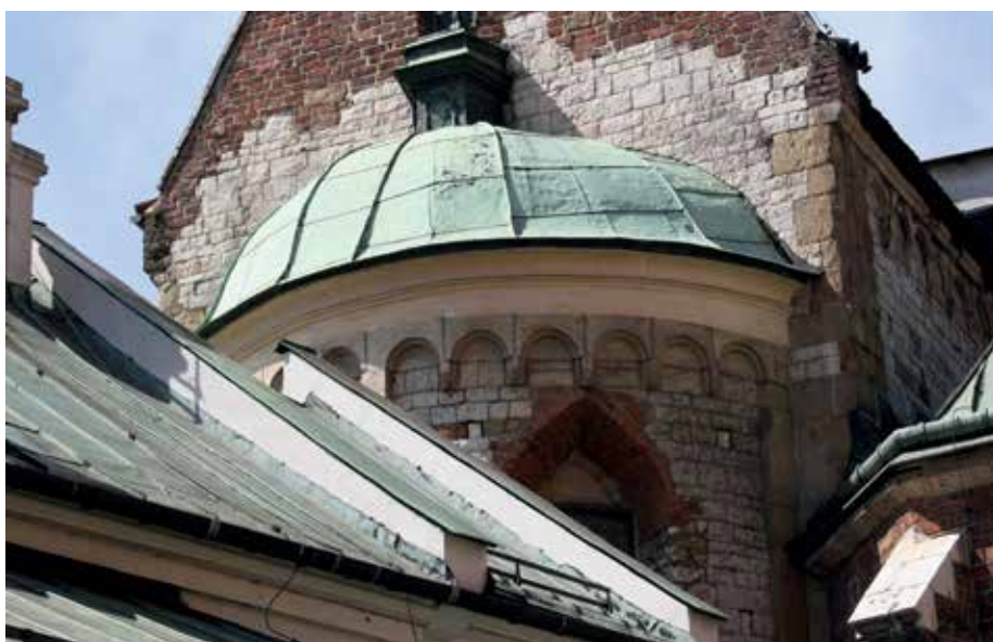
Илл. 5. Костел св. Анджея, Краков, аркатура на абсиде

столбам 12 (в галицких памятниках они не зафиксированы, поскольку храмы сохранились на уровне верха фундаментов, а то и ниже), а в ростово-суздальских храмах эти лопатки очень заметны в связной системе членений интерьера. Но малопольские памятники всегда вытянуты, хоть немного, по продольной оси, тогда как ростово-суздальские храмы стремятся к центричности. Это тоже свидетельство работы древнерусского архитектора.