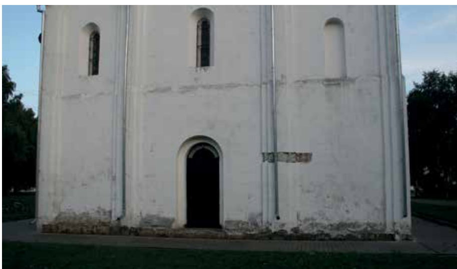
Илл. 10. Спасо-Преображенский собор, Переславль- Залесский, уступ на середине высоты

способ их расчленения. Этот способ выдержан в соборе Переславля в абсидах, круглящая поверхность каждой из трех абсид является филенкой, ограниченной цоколем внизу, лопатками по сторонам (они расположены на стыках средней и боковых абсид и в местах примыкания боковых абсид к коротким заплечикам на восточном фасаде). В Кидекше с помощью филенок (у которых не было низа, нижнего рамочного поля) обработаны нижние части прясел фасадов: здесь филенка ограничена двумя тягами по сторонам (они примыкают к лопаткам), эти тяги переходят в аркатурный пояс, тем самым замыкая прясло с трех сторон. Отсутствие тяги или цоколя внизу говорит уже о некоторых „потерях” романской манеры в Кидекше: хотя прясло с аркатурой является более развитой формой, чем прясло с уступом (как в Переславле), но