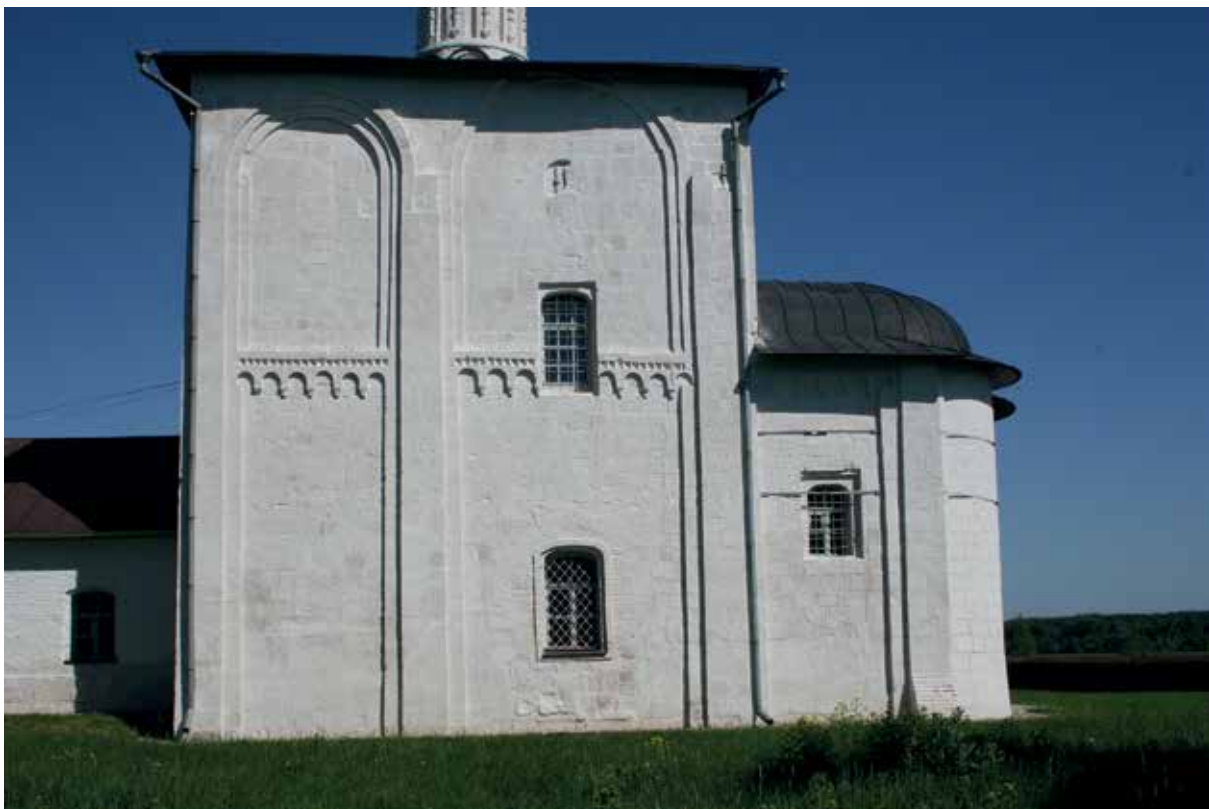
Илл. 2. Церковь Бориса и Глеба, Кидекша, вид с юга