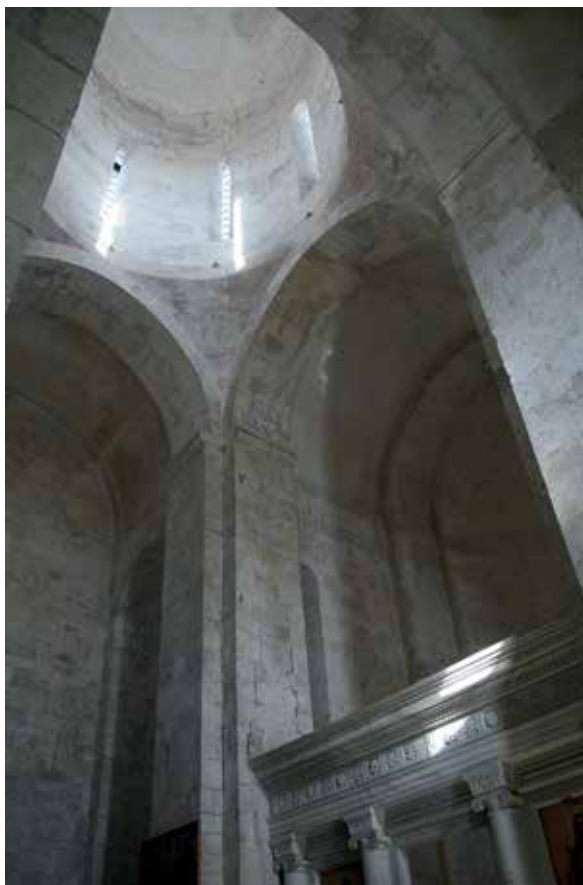
Илл. 12. Спасо-Преображенский собор, Переславль-Залесский, интерьер с видом подкупольного пространства

дальской земли, а также при анализе построения внешней стороны их оболочки.