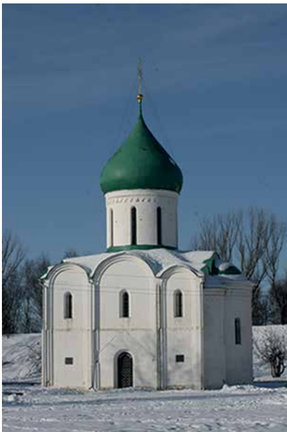
Илл. 1. Спасо-Преображенский собор, Переславль, вид с юга

вопрос о возможности прихода в Ростово-Суздальскую землю галицких мастеров. 1 Ученый считал, что приход мастеров из Галича на северо-восток Руси был возможен, но „их деятельность и закончилась строительством Юрия”. 2 В примечании к этому положению Н. Н. Воронин писал, что возможен был и непосредственный путь мастеров с Запада. 3 Это предположение Н. Н. Воронин развил в книге Зодчество Северо-Восточной Руси , где уже была уверенно изложена только версия о переходе мастеров из Галича во Владимиро-Суздальскую Русь. 4