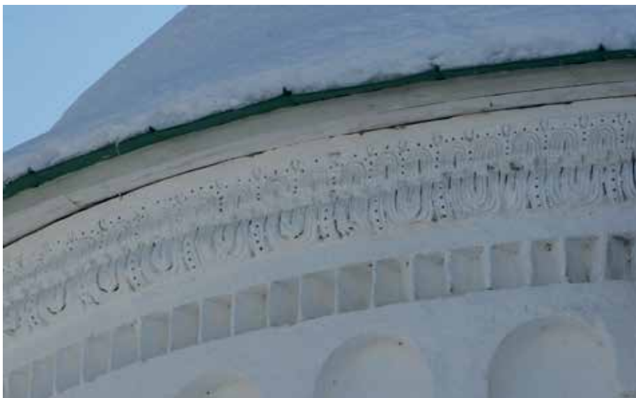
Илл. 6. Спасо-Преображенский собор, Переславль- Залесский, декорированный вал на абсиде