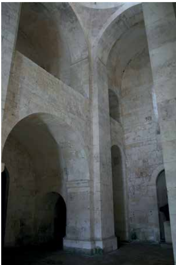
Илл. 11. Спасо-Преображенский собор, Переславль-Залесский, интерьер с импостами в западной части