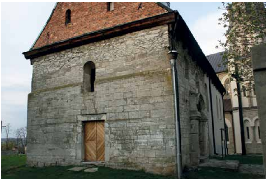
Илл. 9. Костел, Сулиславице, уступ на середине высоты