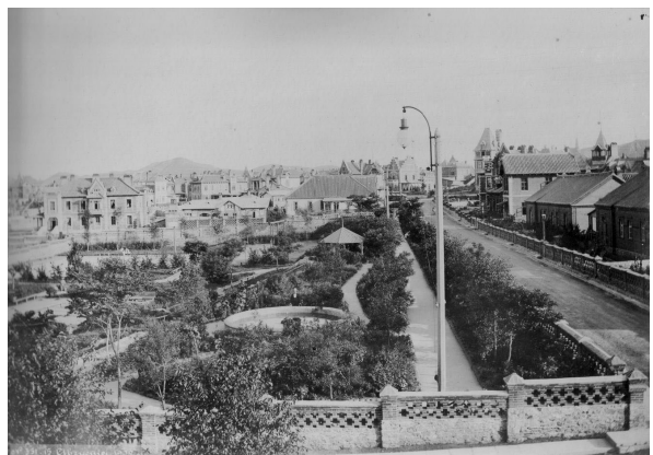
Илл. 11. Панорамный вид г. Дальнего

Генеральный план, чертежи типовых и уникальных построек Дальнего, как и других городов и поселков КВЖД, были литографированы и выпущены Альбомами типовых чертежей (1901–1903), также издан фотоальбом Дальний (1902), что сегодня позволяет идентифицировать и атрибутировать сохранившиеся постройки в Даляне, хотя и сильно обветшавшие за прошедший век. Архивные фотографии как достоверные свидетельства уже эффективно использованы при реконструкции Даляня. В рамках программы создания Русской, Корейской и Японской улиц в начале 2000-х реализован проект так называемой Русской улицы. В 2009–2012 годах проведена реновация еще одного