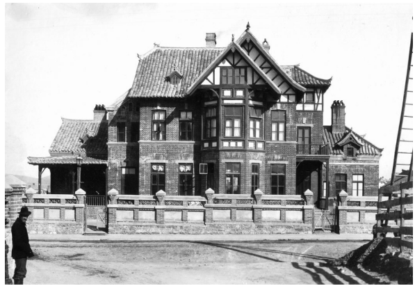
Илл. 8. Дом на две квартиры, Дальний, 1902