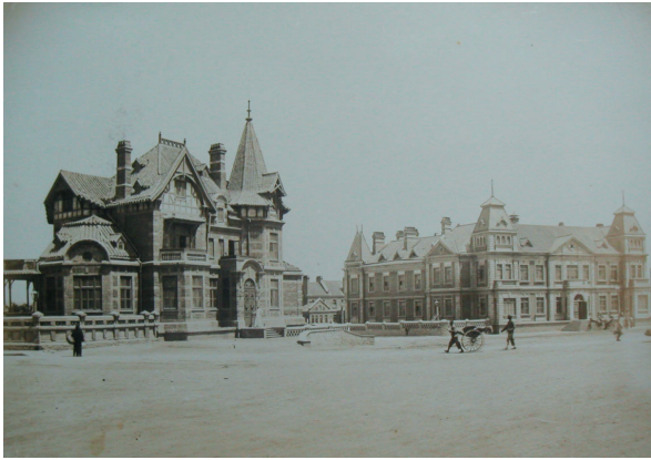
Илл. 7. Дом управляющего и Управление морского пароходства в г. Дальнем