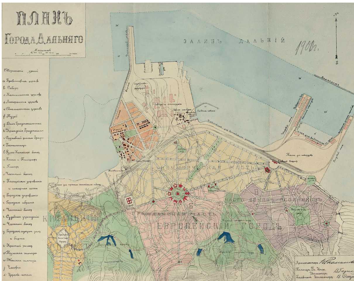
Илл. 4. Генеральный план г. Дальнего, арх. К. Г. Сколимовский, 1900, Российский государственный исторический архив, Санкт-Петербург, ф. 350, оп. 18, д. 26, л. 2

новый план города. Кое-что в проекте Сколимовского из плана Сахарова учтено: например, местоположение рекреационных зон, символическая топонимика: Московский, Владимирский проспекты, Английский сад, Красная площадь и т.п. (илл. 4).