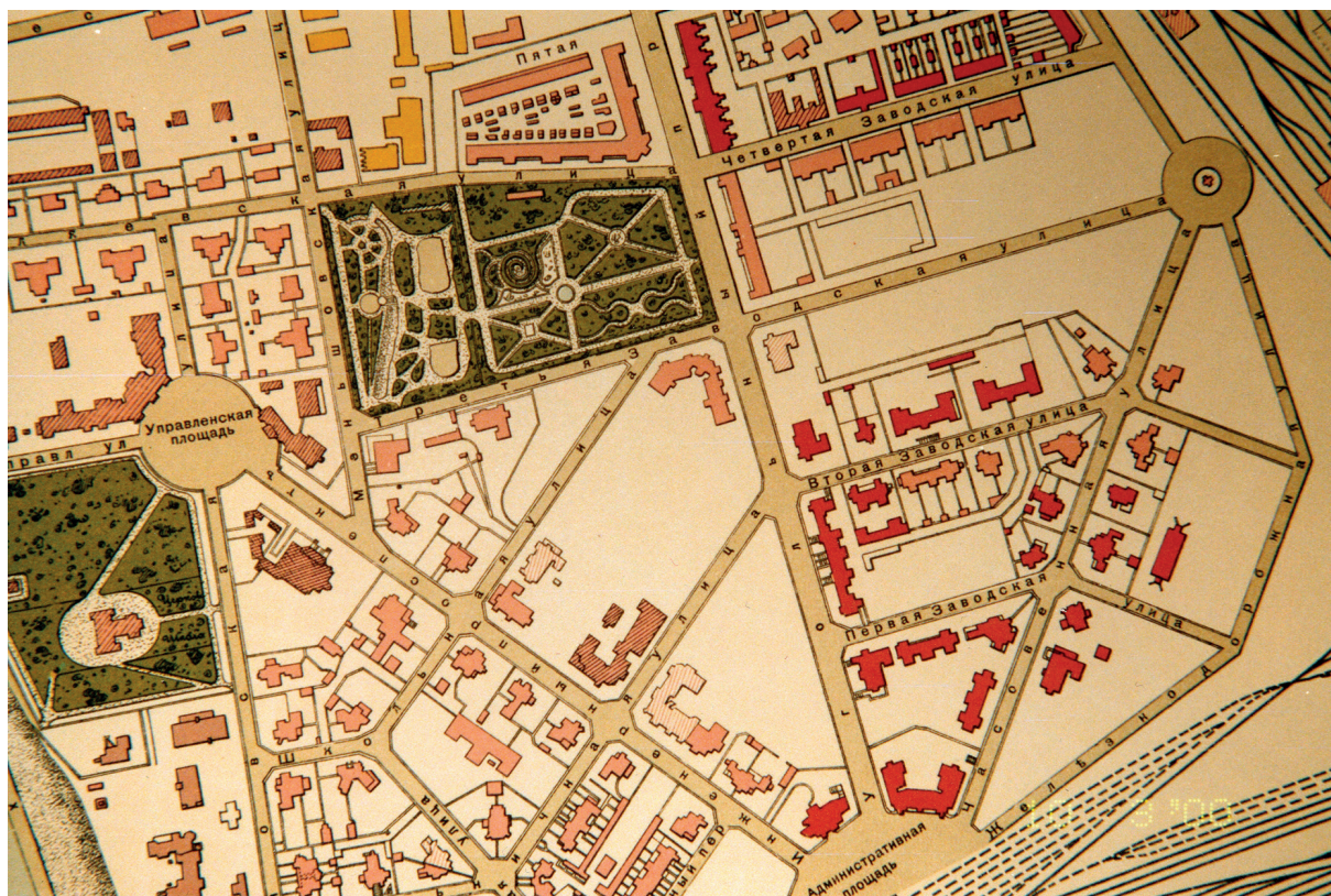
Илл. 6. Проект детальной планировки Административного городка г. Дальнего, фрагмент

на с живописностью объемно-пространственного решения, минимальностью (а зачастую и полным отсутствием) декора (роль декора исполнял фахверк), с ориентацией на национально-романтические прообразы, что и отличает его от интернационального модерна (илл. 7–9).