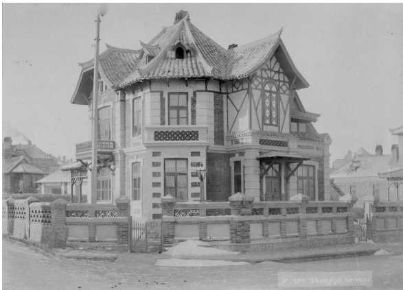
Илл. 9. Особняк, Дальний, 1901