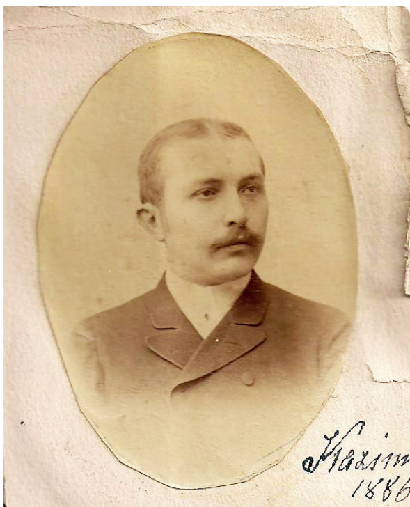
Илл. 1. Казимир Сколимовский, Фотопортрет, 1886, из личного архива Ежи Сколимовского, внука Сколимовского; публикуется впервые

тексте исторической эпохи, стало возможным провести новое исследование биографии зодчего, а в ее отраженном свете и особенностей его творческого наследия.