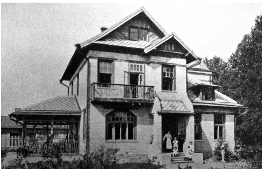
Илл. 14а–б. Жилые дома (на две семьи и на одну семью) в пос. Дятьково Орловской губернии Мальцевских заводов, 1905, из: Зодчий , 52 (1906): (Приложение, л. 56, XXXV – 1906)