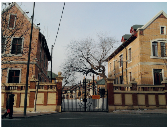
Илл. 13а–д. Реновация русской исторической застройки в Дальяне, проект и реализация 2009–2012 годов, современное использование: Гостиница «1896 год. Железнодорожный парк-отель», фот. Е. М. Третьяковой, 2013

ему приходилось заниматься объектами самого разного масштаба, от проектирования города до отдельных зданий, а также руководить реализацией.