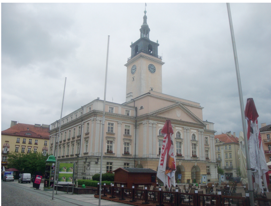
Илл. 15. Городская ратуша, Польша, Калиш, фот. Л. Садовского, 2013