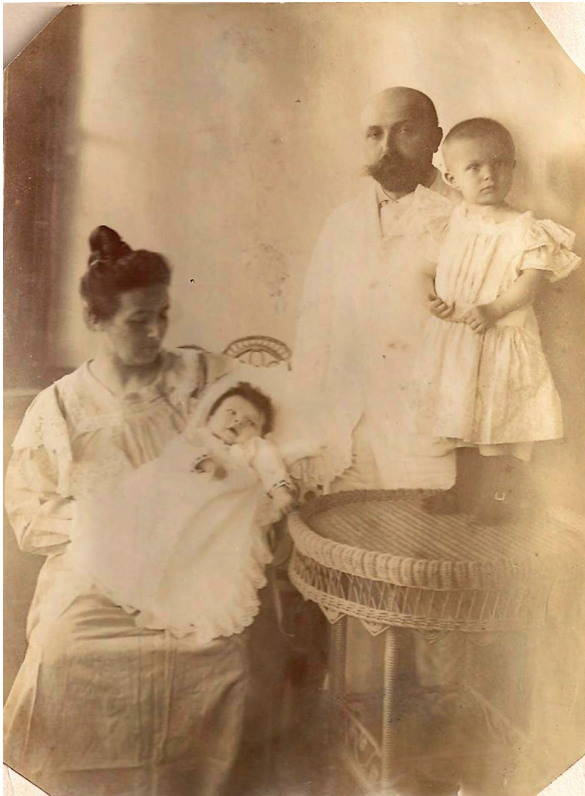
Илл. 2. Семья Сколимовских, Дальний, 1902; публикуется впервые