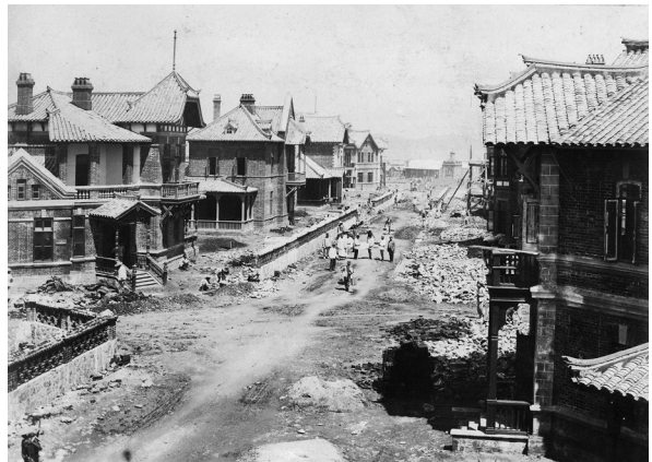
Илл. 10. Дом на 2 квартиры, Дальний, 1901, из: Альбом фотографий техника путей сообщения Н. М. Протопопова

Генеральный план, чертежи типовых и уникальных построек Дальнего, как и других городов и поселков КВЖД, были литографированы и выпущены Альбомами типовых чертежей (1901–1903), также издан фотоальбом Дальний (1902), что сегодня позволяет идентифицировать и атрибутировать сохранившиеся постройки в Даляне, хотя и сильно обветшавшие за прошедший век. Архивные фотографии как достоверные свидетельства уже эффективно использованы при реконструкции Даляня. В рамках программы создания Русской, Корейской и Японской улиц в начале 2000-х реализован проект так называемой Русской улицы. В 2009–2012 годах проведена реновация еще одного