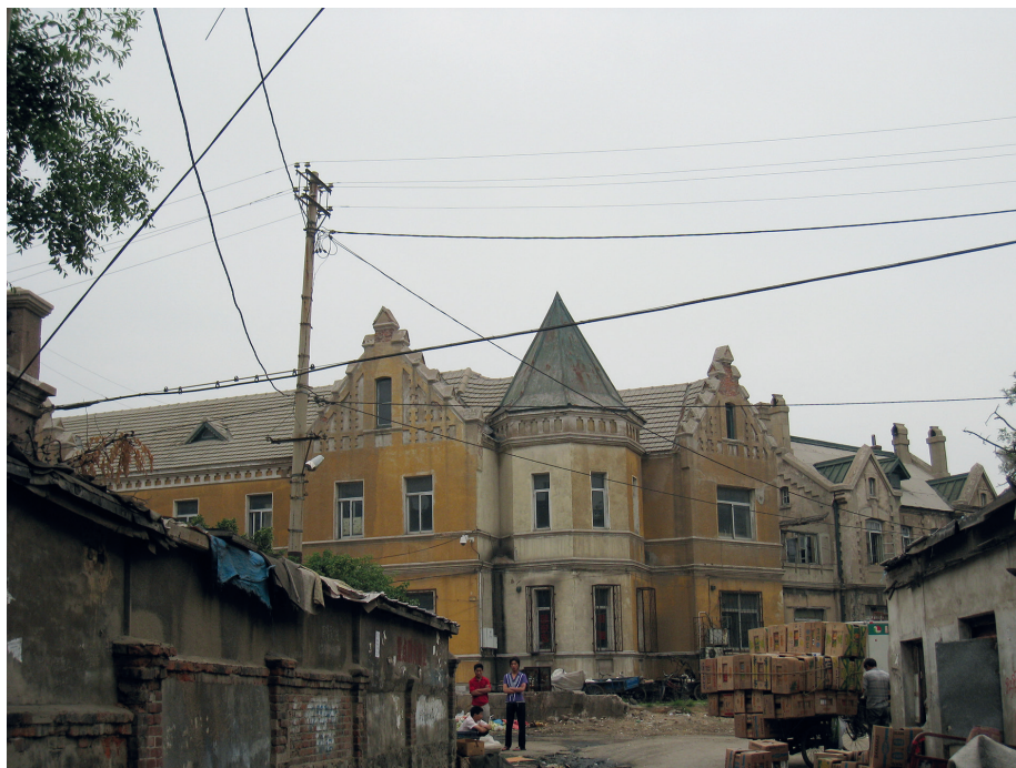
Илл. 12. Русская историческая застройка Даляня, фот. С. С. Лешко, 2009

квартала русской исторической застройки начала XX века (илл. 12–13а–d). 20